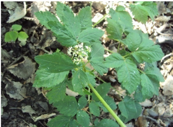
Figure 12 : Physospermum verticillatum (Waldst. & Kit.) Vis.