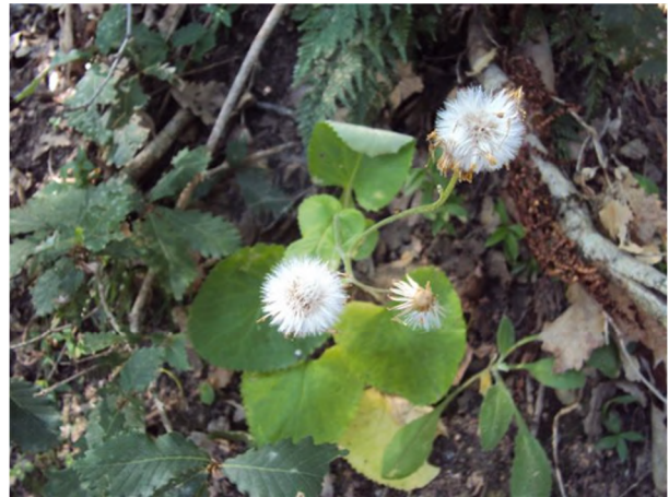
Figure 9 : Senecio perralderianus Coss. & Dur.