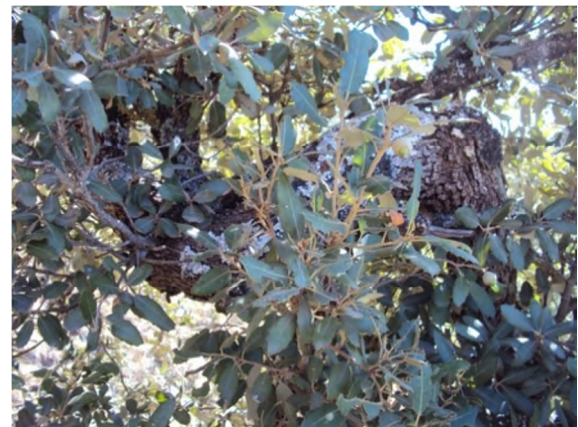
Figure 17 : Quercus ilex subsp. ballota (Desf.) Samp.