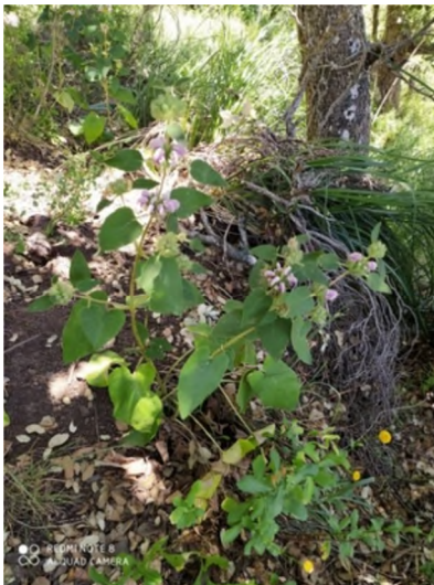
Figure 3 : Phlomis bovei De Noé