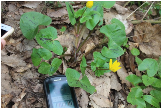
Figure 16 : Ranunculus ficariiformis (F. W.) Schultz.