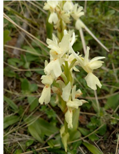
Figure 15 : Androrchis pauciflora subsp. laeta