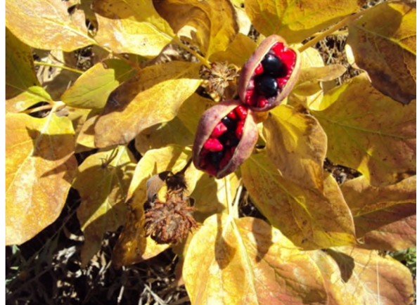
Figure 7 : Paeonia mascula (L.) Mill. subsp. atlantica (Cosson.) Greuter & Burdet