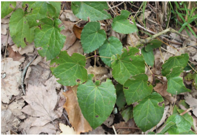
Figure 1 : Epimedium perralderanum Coss.