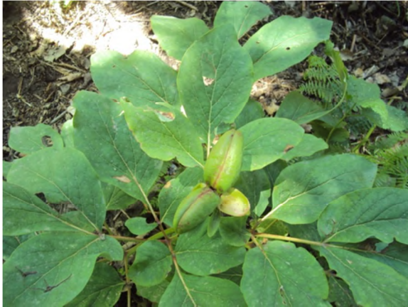
Figure 6 : Paeonia mascula (L.) Mill. subsp. atlantica (Cosson.) Greuter & Burdet