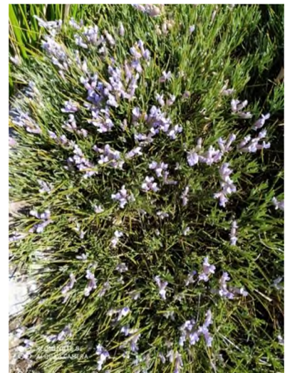
Figure 21 : Cedrus atlantica (Endl.) Carrière