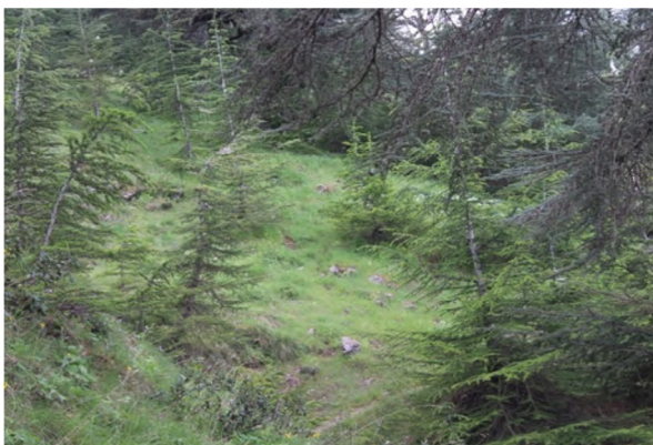
Figure 23 : Cedrus atlantica (Endl.) Carrière