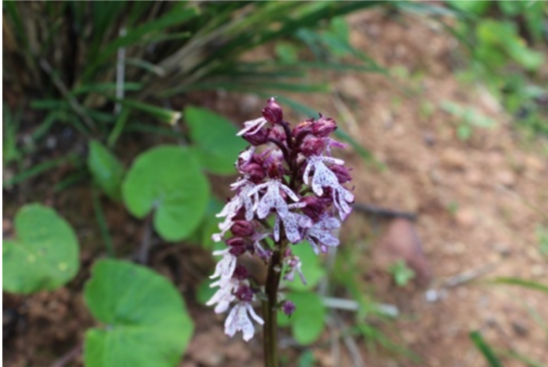
Figure 14 : Orchis purpurea Huds. subsp. purpurea