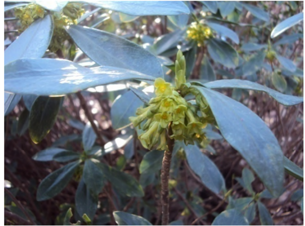
Figure 11 : Daphne laureola Coss.