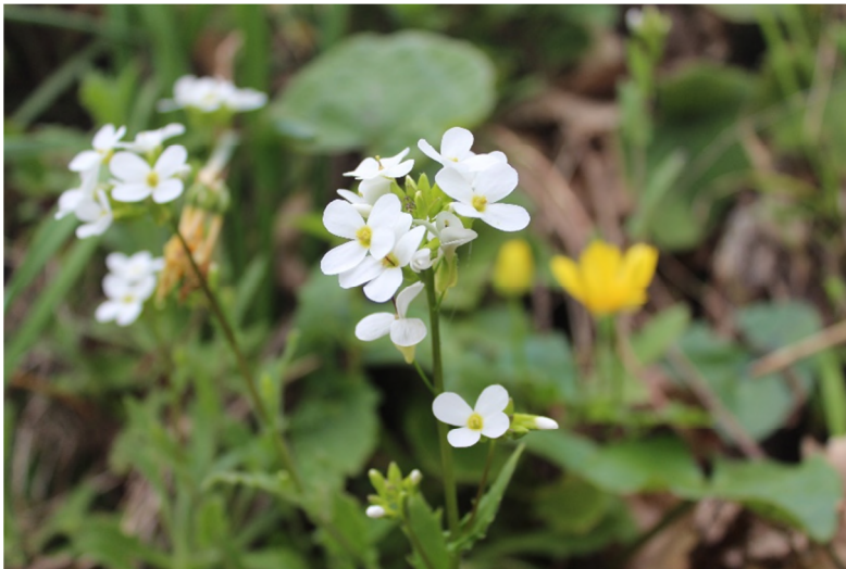
Figure 20 : Erinacea anthyllis Link