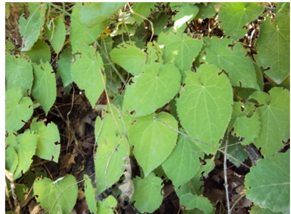
Figure 2 : Epimedium perralderanum Coss.