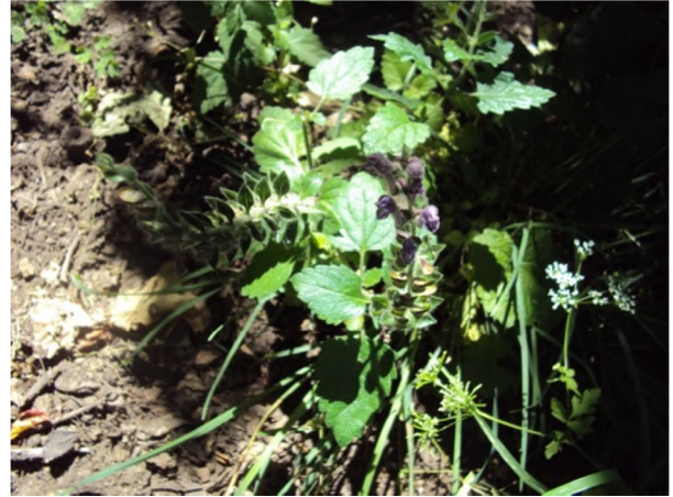
Figure 19 : Scutellaria columnae All.