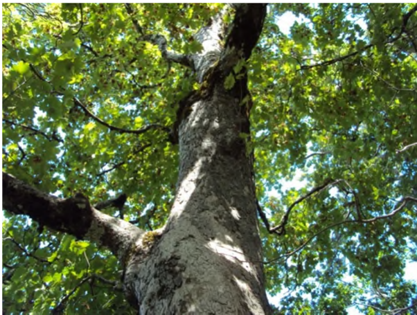
Figure 8 : Acer obtusatum Waldst. & Kit. Ex Willd.