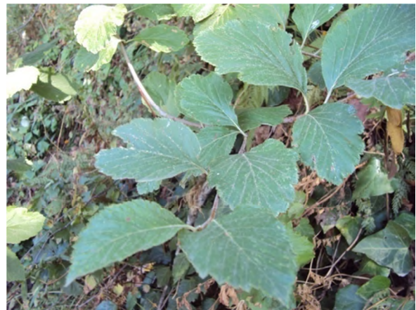
Figure 13 : Fig. 13: Sorbus aria (L.) Crantz