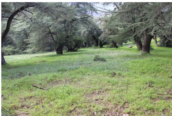
Figure 22 : Cedrus atlantica (Endl.) Carrière