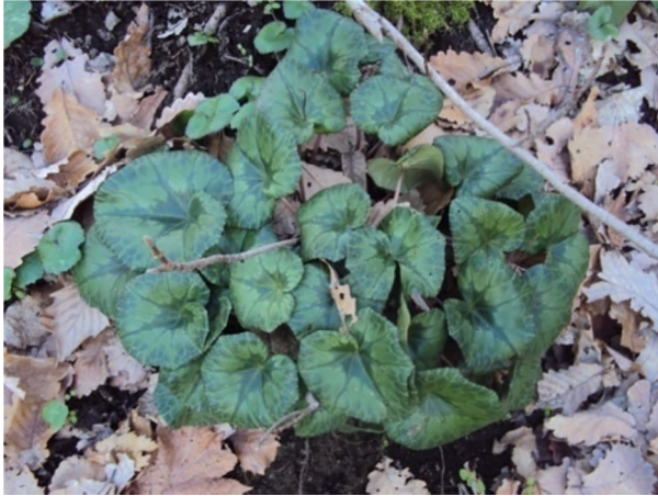
Figure 18 : Cyclamen africanum Boiss. & Reut.