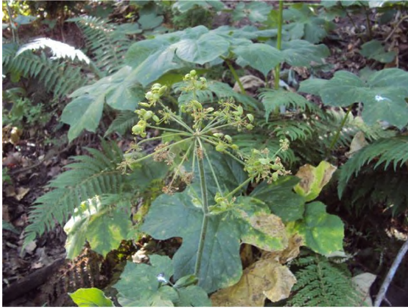
Figure 10 : Heracleum sphondylium L. subsp. algeriense