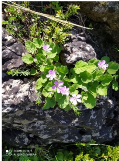
Figure 4 : Erodium battandieranum Rouy