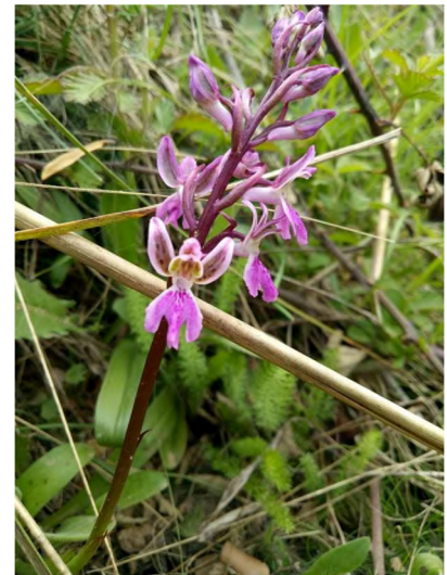
Figure 5 : Androrchis patens Desf.