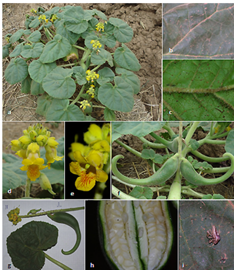
Figure 2 : Illustration d' Ibicella lutea . Akbou (NE-Algérie), 9.8.2018

imbriqués. La marge est entière à sinueuse, irrégulièrement denticulée. Cinq nervures principales palmées partent de la base. Les deux faces sont couvertes d'une pubescence glanduleuse. L'inflorescence est une grappe dressée comportant 10 à 60 fleurs tubulaires zygomorphes de couleur jaune, tachetées et veinées de rouge. La fleur présente un tube conique de 2 à 3 cm de long surmonté de 4 lobes dorsaux arrondis et un lobe ventral plus grand. Le fruit est une capsule bivalve ovoïde de 5 à 10 cm de long et 2,5 à 3,5 cm de diamètre dans la partie la plus large. Il est prolongé d'un long bec effilé mesurant jusqu'à 14 cm de long et recourbé en corne de bouquetin. À maturité, le bec se sépare en deux appendices recourbés.