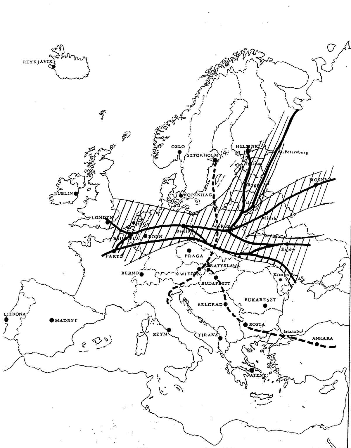
Figure 2 - La localisation de la Pologne par rapport à l'axe géopolitique européen et aux voies de communication