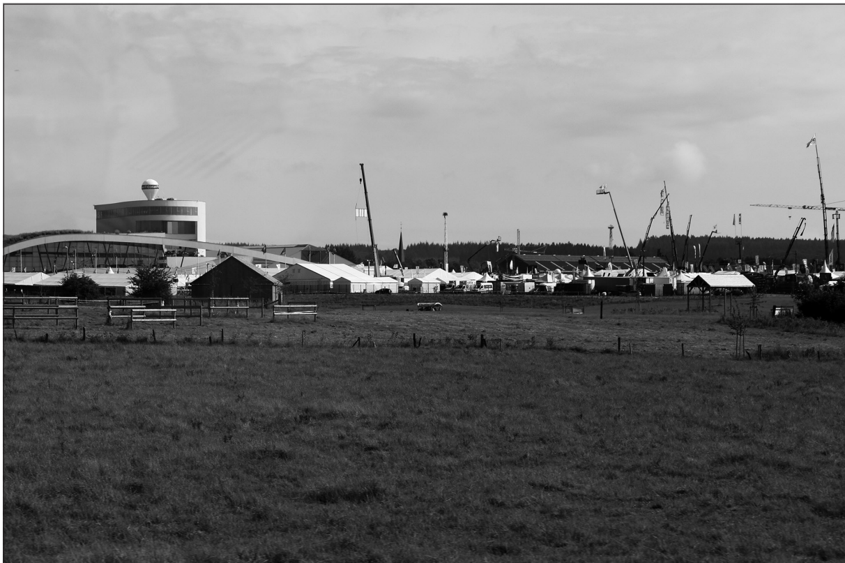
Photo 5. Vue sur la Foire de Libramont

Le dernier jour a commencé par une visite de la foire de Libramont. Cette immense exposition en plein air accueille, chaque année, plus de 220.000 visiteurs, avec 800 exposants et 5.000 marques, sur un site couvrant 300.000 m 2 (Photo 5). Il s'agit d'une vitrine remarquable pour le monde rural : la machinerie, l'élevage, la sylviculture, l'industrie agroalimentaire, l'horticulture, la recherche, l'éducation et la culture. C'est un événement économique qui promeut les métiers ruraux dont l'agriculture, l'élevage, la sylviculture. Cette foire met en avant les dernières innovations et pratiques techniques. Elle permet d'avoir une vision large de l'agriculture et des pratiques de développement rural en Wallonie et en Belgique et permet de débattre sur l'avenir et les défis de l'agriculture. Une attention particu-