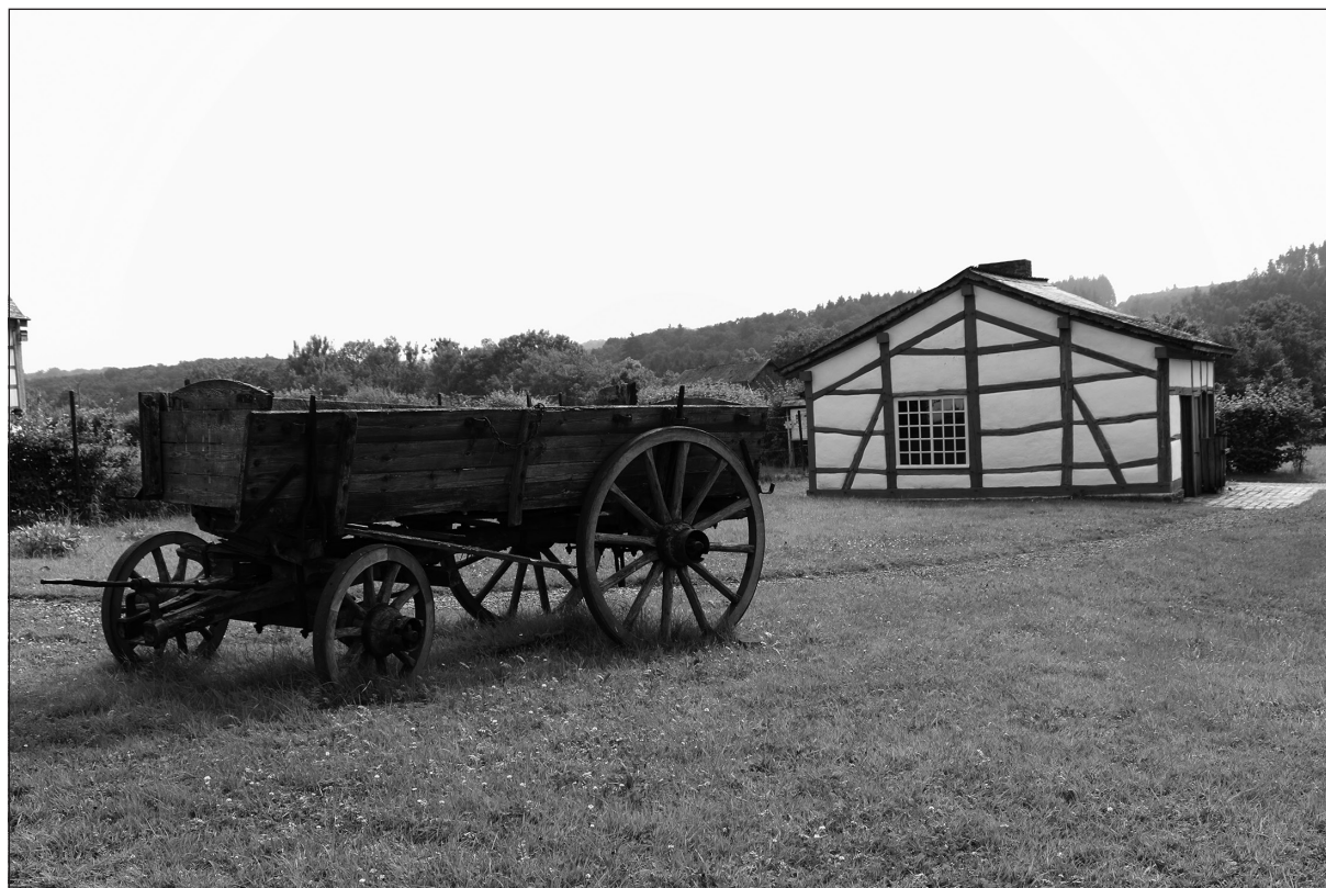
Photo 7. Une maison ardennaise reconstituée au domaine du Fourneau Saint-Michel

Le dernier arrêt au domaine muséal du Fourneau Saint-Michel est quelque peu anachronique parce qu'il nous présente une ruralité passée et oubliée mais aussi parce qu'il correspond à une façon de préserver le patrimoine qui ne correspond plus au crédo de la protection du patrimoine actuelle qui privilégie le maintien sur site et la recherche de nouvelles fonctions. Ce site d'environ 50 ha « a pour caractéristique d'être composé de bâtiments anciens, démontés dans leur village d'origine et reconstruits sur le domaine, ou seulement reconstitués à l'identique. On compte une soixantaine de bâtisses, affectée en lieux de vie et d'ateliers d'artisans, mais aussi de réserve pour les 50.000 objets de collection, ou encore en espaces de travail pour le personnel. Ils sont organisés en hameaux typiques de l'architecture rurale traditionnelle wallonne du sud du Sillon Sambre-et-Meuse : habitations, fermes, chapelle, école » (Peuckert, 2016, p. 88) (Photo 7). Le domaine touristique et culturel du Fourneau Saint-Michel offre une mise