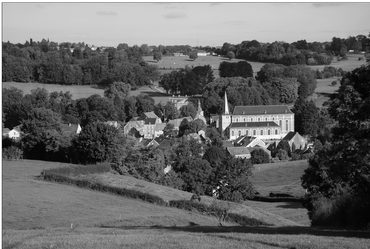
Photo 2. Le village de Soiron