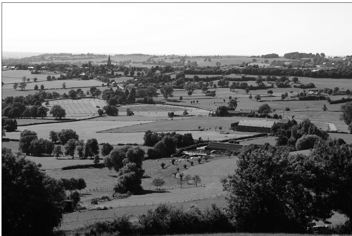
Photo 1. Paysage de bocage de l'Entre-Vesdre-et-Meuse vu du cimetière américain de Henri-Chapelle

Pourtant ce paysage « idyllique » et regretté ne remonte pas à des temps immémoriaux. Au Moyen Âge, les paysages de cette région étaient plus proches d'un système agricole ouvert avec de nombreux labours. À partir du 15 e siècle, la fabrication et le commerce de la laine et des tissus deviennent importants dans la vallée de la Vesdre, notamment à Verviers et à Eupen. La laine provient des moutons qui parcourent les abondantes landes avoisinantes. Au 16 e siècle, le paysage de l'Entre-Vesdre-et-Meuse se modifie et de nouvelles pra-