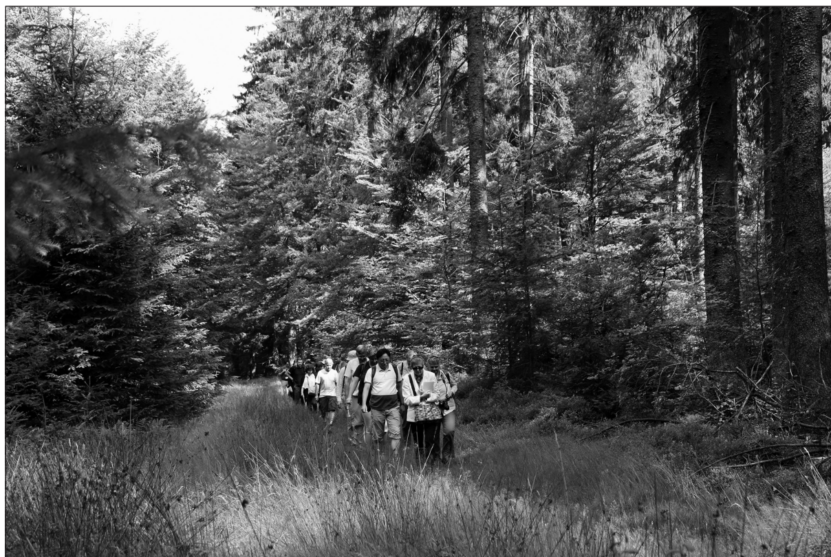
Photo 4. La forêt jardinée du Grand Bois à Vielsalm