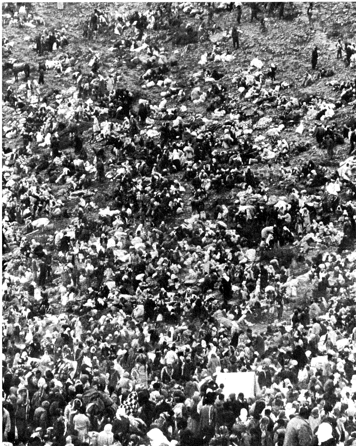
Doc. 1 : Photo de sensibilisation : camp de réfugiés kurdes