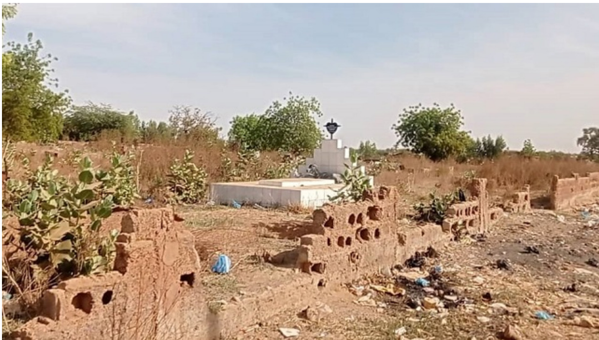
Photo 2. État de la clôture du cimetière de Toudweogo.

Le vigile du cimetière militaire français, dit « PDG », justifie par exemple l'arrachage des épitaphes des tombes par le fait que le fer est devenu comme de l'or à Ouagadougou à tel point que tous les moyens sont utilisés pour s'en acquérir.