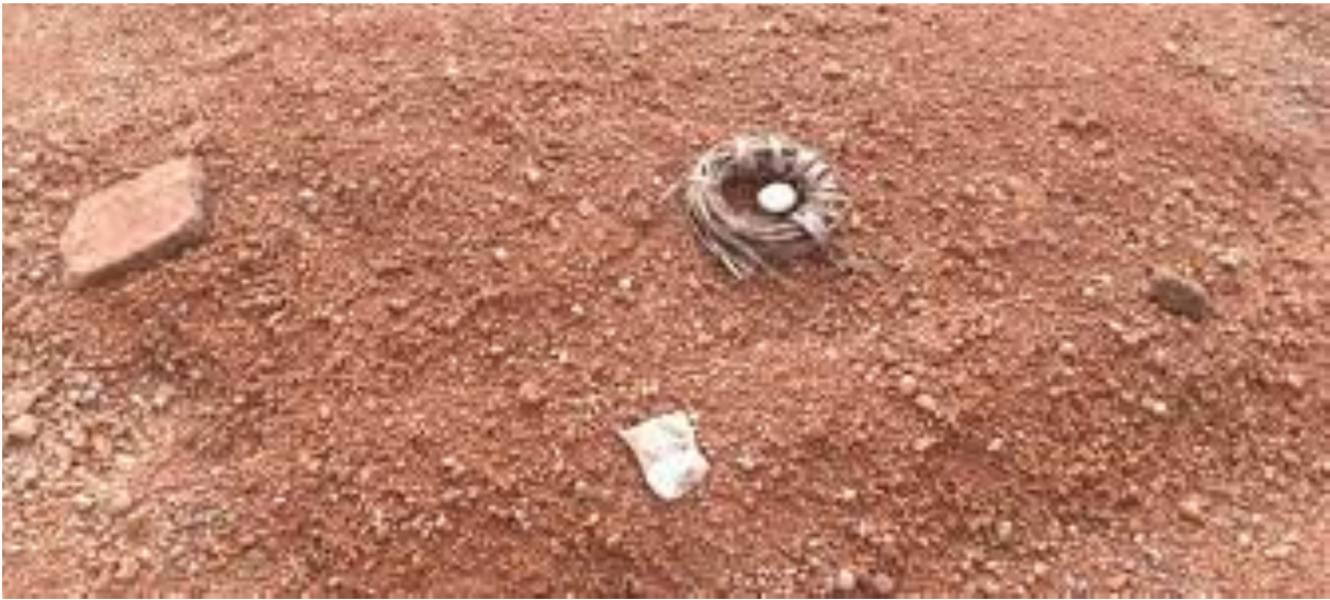
Photo 1. Pratiques occultes sur une tombe au cimetière de Bonam.