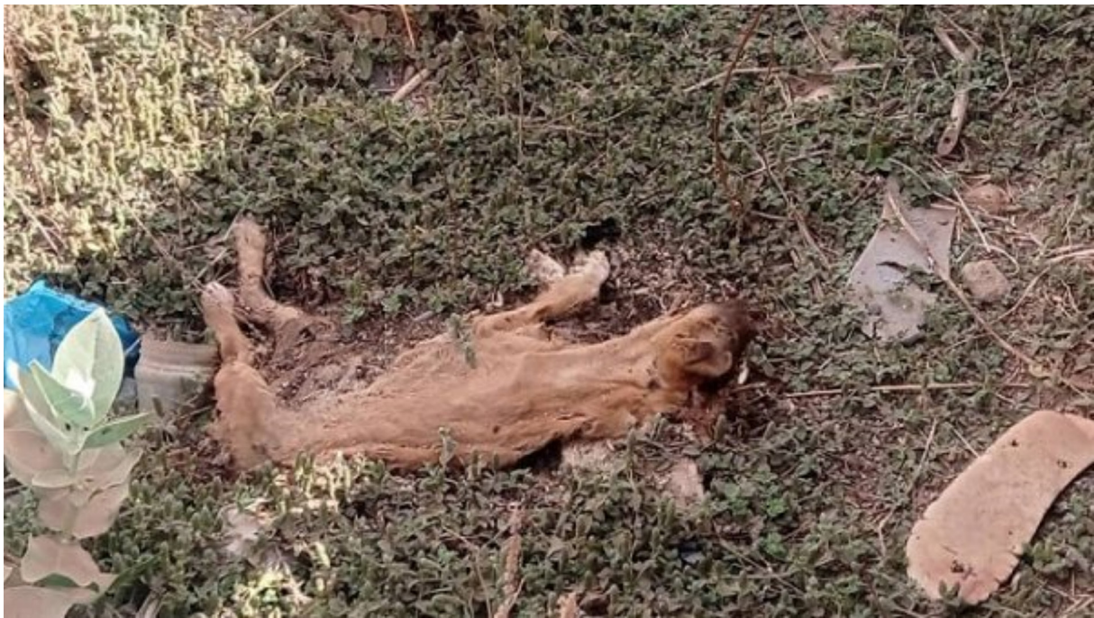
Planche 1. Reste d'un chien mort et rejet d'ordures au cimetière de Karpala.

Par ailleurs, tandis que certains citoyens se servent de ces lieux funéraires pour faire des abattages clandestins d'animaux à consommer, d'autres les utilisent pour des pratiques occultes comme les sacrifices pour rechercher des protections ou honorer des promesses faites aux génies ou aux ancêtres. La Photo 1 prise au cimetière de Bonam présente un sacrifice fait sur une tombe au travers d'un poulet noir, de deux morceaux de charbon et de cauris attachés dans un sachet blanc.