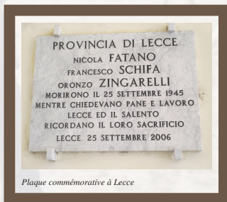
Plaque commémorative à Lecce