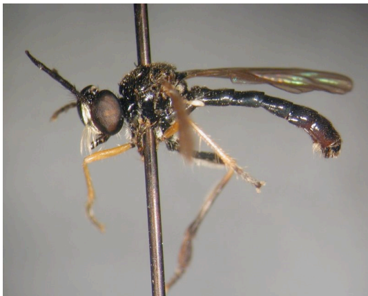
Figure 4: Dioctria longicornis Meigen 1820.

Belgique: Modave pont de Bonne, 1♀, 11.vi.1950; Bassenge, 1♀, 17.vii.1953; Belvaux, 1♀, 23.vi.1963.