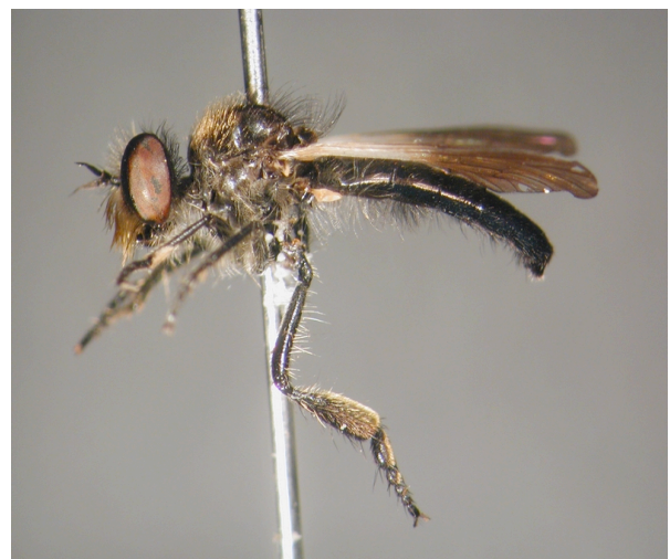
Figure 7: Holopogon nigripennis (Meigen 1820).

Espèce considérée comme très rare chez nous (Tomasovic, 1998a). C'est la seule espèce du genre connue avec certitude en Belgique (Tomasovic, 1998b).