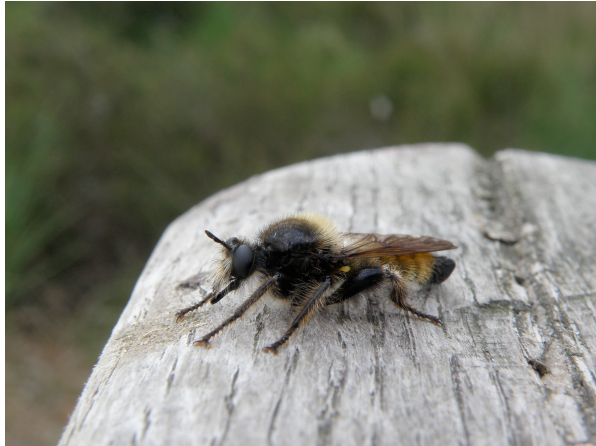
Figure 5: Laphria flava (Linnaeus, 1761).

30.v.1957; Tienne de Wellin, 1♂, 1.vii.1955; Sourbrodt, 1♂, 5.viii.1956; Meix devant Virton, 1♂, 3.vi.1963; Elsenborn, 1♀, 18.vii.1928. Luxembourg: Pintsch, 1♀, 10.vi.1976.