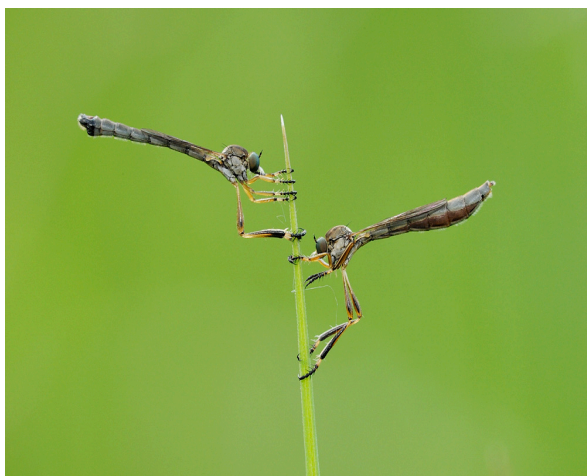
Figure 6: Leptogaster cylindrica (De Geer 1776).

Leptogaster cylindrica (De Geer 1776) (Figure 6, Y. Barbier) Belgique: Bassenge Bois Béchet, 1♀, 3.vii.1949.