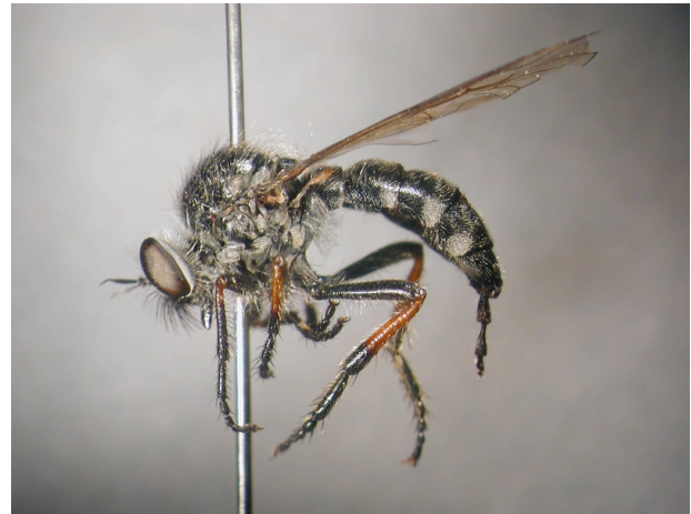
Figure 3: Leptarthrus brevis (Meigen 1804).

En Belgique, l'espèce était considérée comme rare en 1910 puis, en 1996, elle est passée au statut de commune (Tomasovic, 1998). En Flandre Orientale, 66 exemplaires furent collectés en 1999 à Stekene (Tomasovic & Dekoninck, 2000) et 182 à Hageven en 2000 (Bonte et al. , 2002). L'espèce est également présente sur le haut massif ardennais et au littoral.