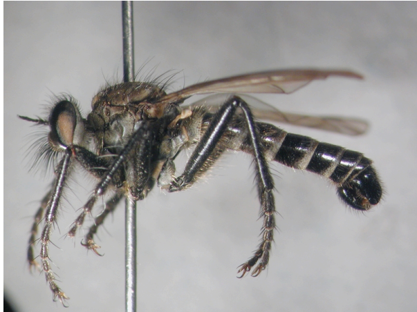
Figure 8: Lasiopogon cinctus (Fabricius 1781).