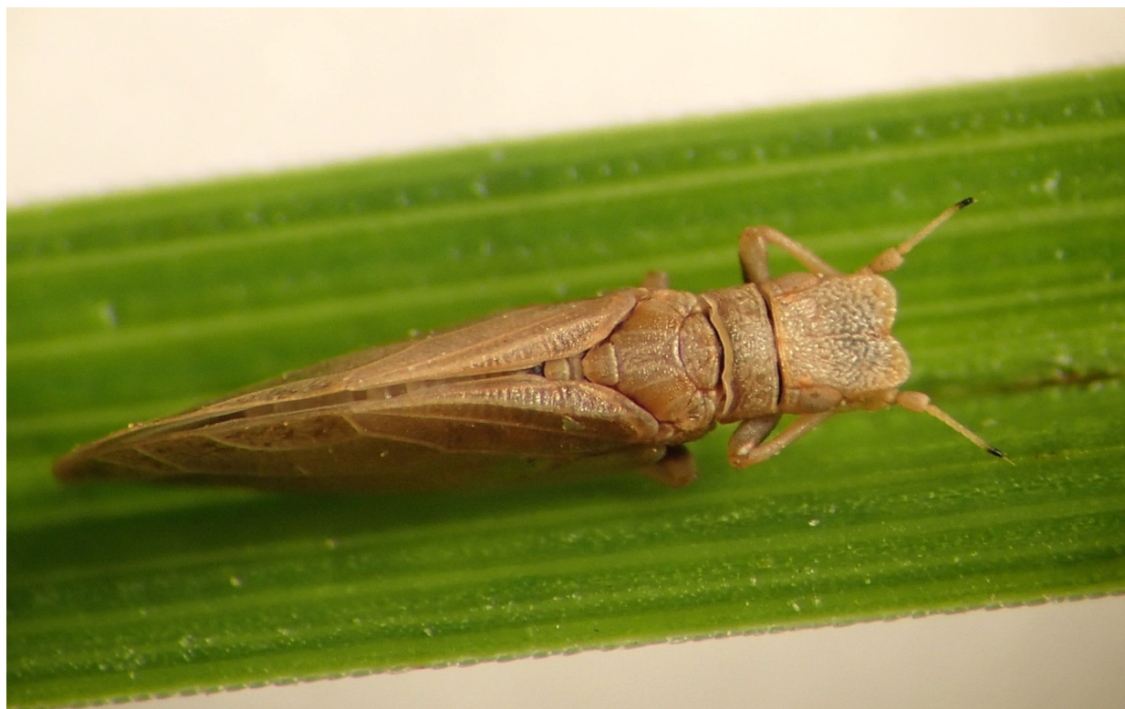
Figure 4 : Livia crefeldensis . Femelle en vue dorsale.