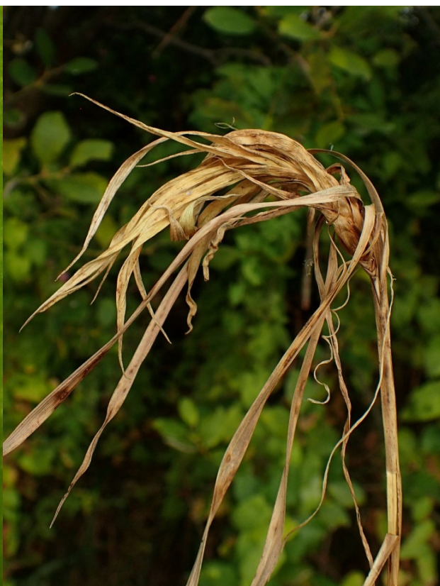
Figure 6 : Galle de Livia crefeldensis sur Carex disticha , Gembloux, 4.ix.2018