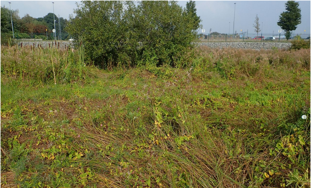
Figure 1 : Habitat de Livia crefeldensis à Gembloux au moment de la seconde observation, 4.ix.2018.

également un peuplement irrégulier de cresson de fontaine ( Nasturtium officinale ). On observe depuis quelques années un développement important des ronces ( Rubus fruticosus s.l.) jusque dans le noyau le plus humide du site.