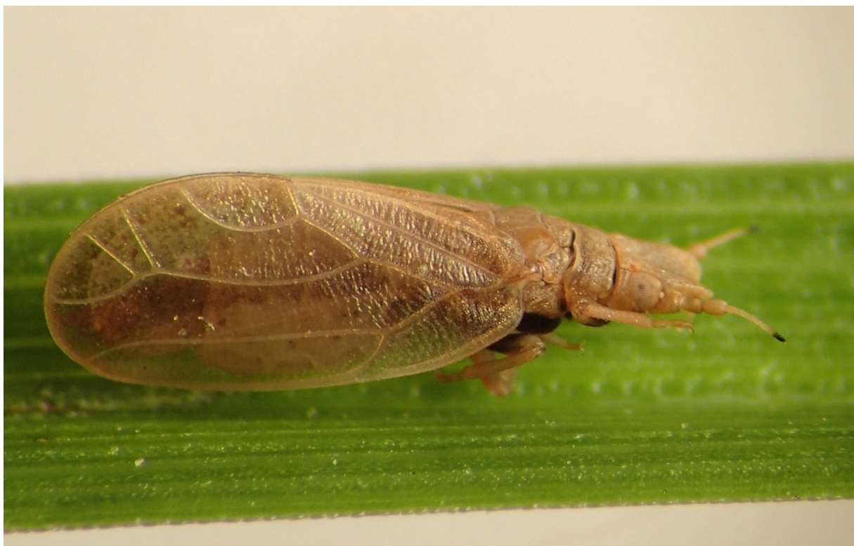
Figure 3 : Livia crefeldensis . Femelle en vue latérale - long. 3,9 mm.

White & Hodkinson (1982) fournissent une clé dichotomique des larves de dernier stade de L. junci et L. crefeldensis . Les principales différences résident dans la conformation du pore anal et des antennes ainsi que dans la présence ( L. crefeldensis ) ou l'absence de soies lancéolées sur les marges de l'abdomen. Les pores anaux des deux espèces sont également bien illustrés par Hodkinson & Bird (2000).