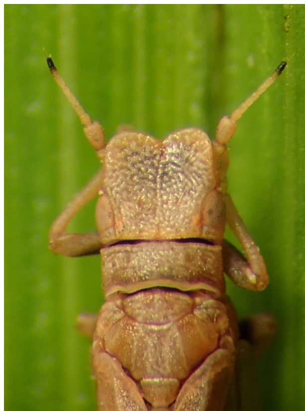
Figure 5 : Livia crefeldensis . Avant-corps en vue dorsale.