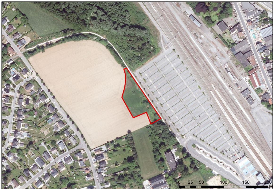
Figure 2 : Situation du marais du Buisson Saint-Guibert à Gembloux : à l'est, le parking de la nouvelle gare SNCB, à l'ouest le champ cultivé (orthophotoplan 2018).