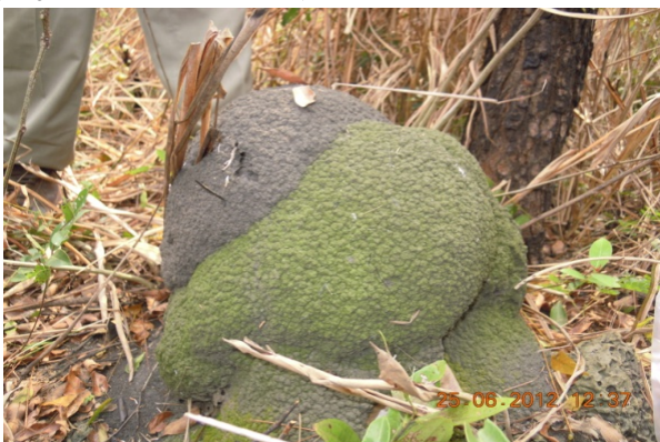
Figure 3. Photo d'un nid en dôme dans une savane arbustive à Duale.

Le genre Cubitermes , présent exclusivement en Afrique sub-saharienne, est un genre de termites humivores qui a colonisé avec succès des milieux très divers depuis la forêt pluvieuse jusqu'aux savanes semi-désertiques. Ces termites construisent des nids en terre, partiellement épigés en forme de colonne soit à sommet « en dôme » (Figure 3) soit surmontée d'un chapeau (Figure 4) qui leur confère l'aspect dit « en champignon ». Les nids occupés ou abandonnés de nombreux Cubitermes sont connus pour abriter des sociétés d'autres espèces de Cubitermes ou même d'autres genres. Les jeunes colonies inquilines trouvent en effet un refuge de choix dans la structure alvéolaire de ces nids (Dejean & Ruelle, 1995).