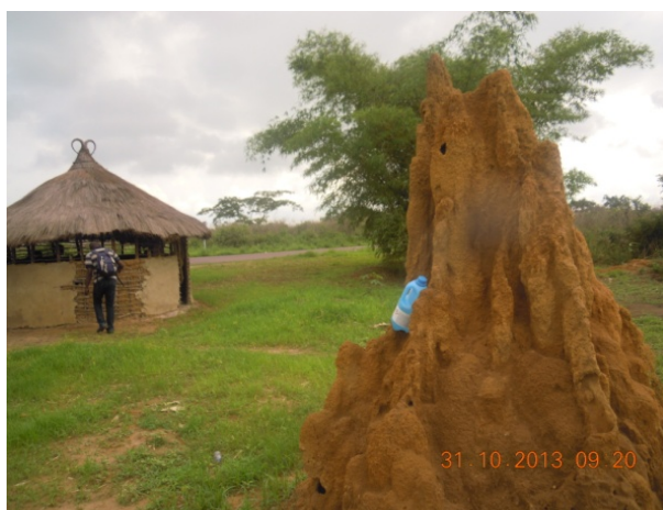
Figure 1. Photo d'un nid cathédrale de Macrotermes (savane à l'entrée de Duale).

Cette espèce xylophage et champignoniste est décrite de Sierra Léone. Signalée dans toutes les Provinces de la RDC, elle est largement distribuée en Afrique occidentale, centrale et orientale depuis la Guinée jusqu'au Kenya (Ruelle, 1970). Elle construit de grands nids « en cathédrale » (Figure 1); les ailés et les soldats sont récoltés pour la consommation humaine.