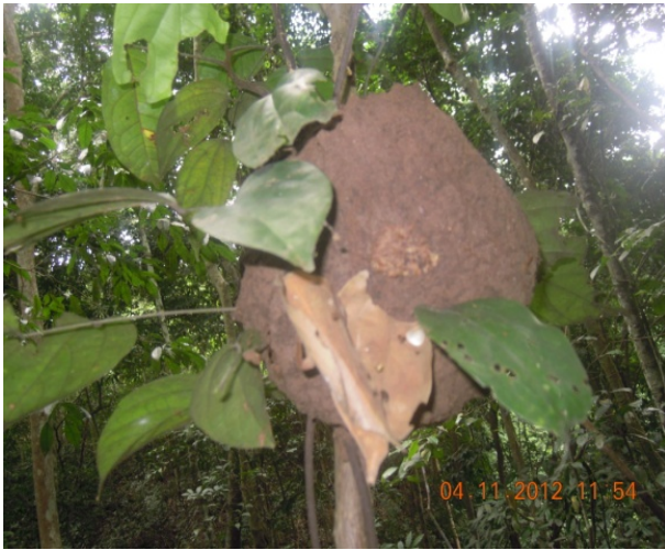
Figure 2. Photo d'un nid arboricole ovoïde dans une forêt-galerie à Bombo-lumene.

localement présente en Afrique occidentale (Côte d'Ivoire et Ghana) en Afrique centrale et en Ouganda.