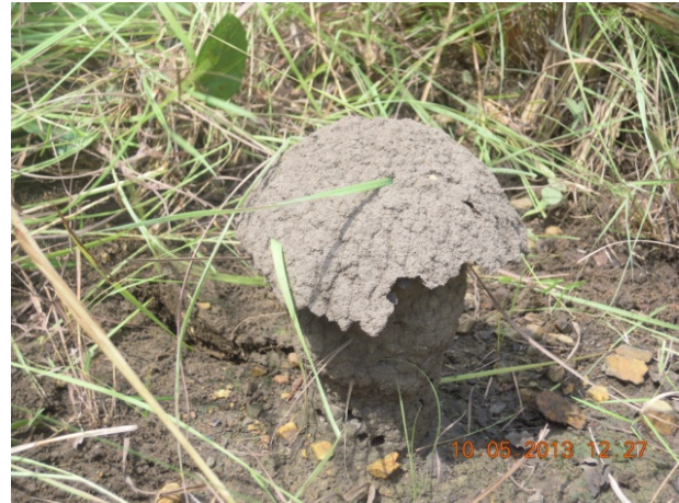
Figure 4. Photo d'un nid en champignon dans une savane herbeuse à Duale.

Le genre est riche de 67 espèces décrites, dont seules celles de l'Est africain ont fait l'objet d'une révision (Williams, 1966). Pour le reste du continent, en l'attente d'une révision générale (entreprise actuellement par Deligne & Josens), la systématique du genre est encore très confuse et les identifications souvent incertaines. Nos échantillons se répartissent en 3 espèces.