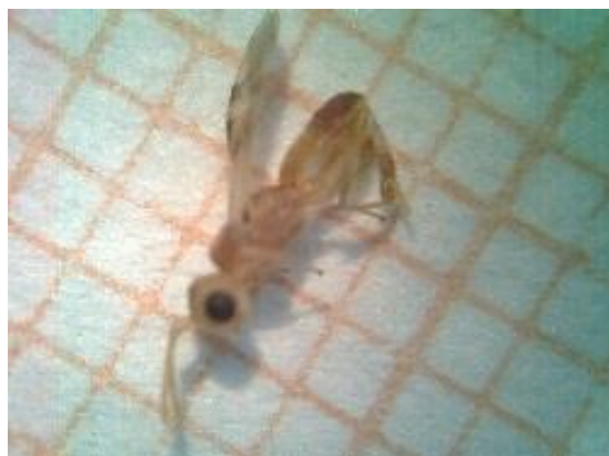
Figure 2: Phanerotoma flavitestacea .