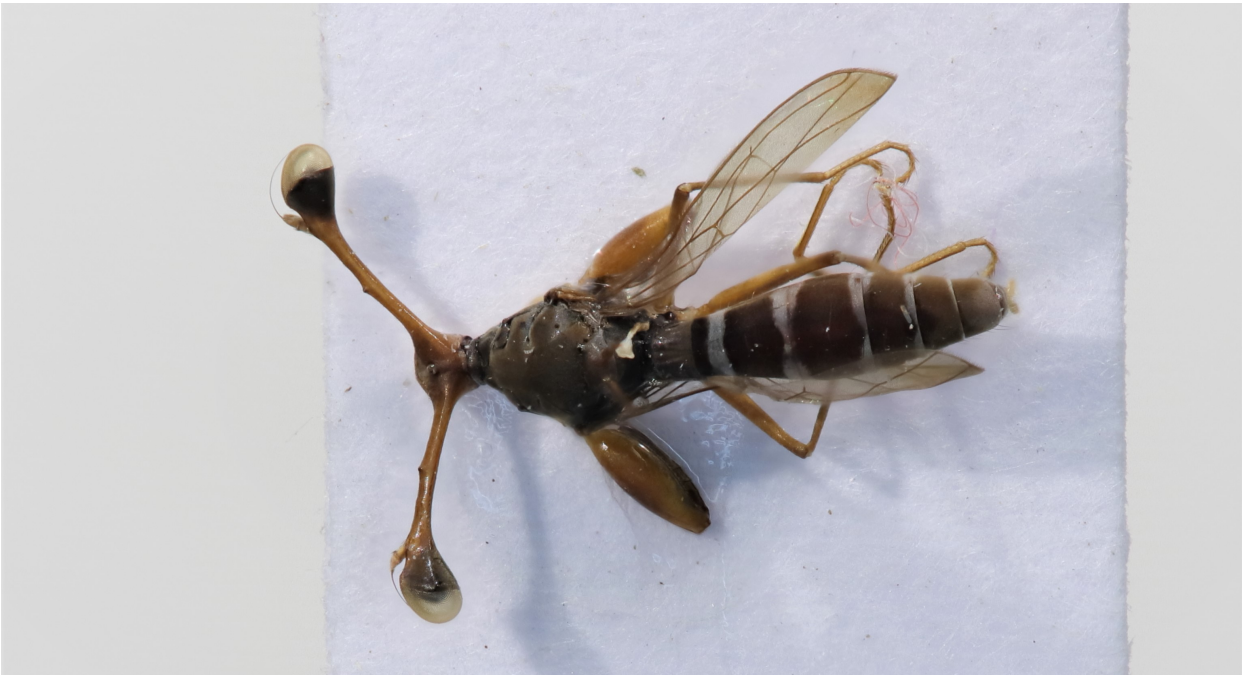
Figure 10 : Diasemopsis signata (Dalman 1817)