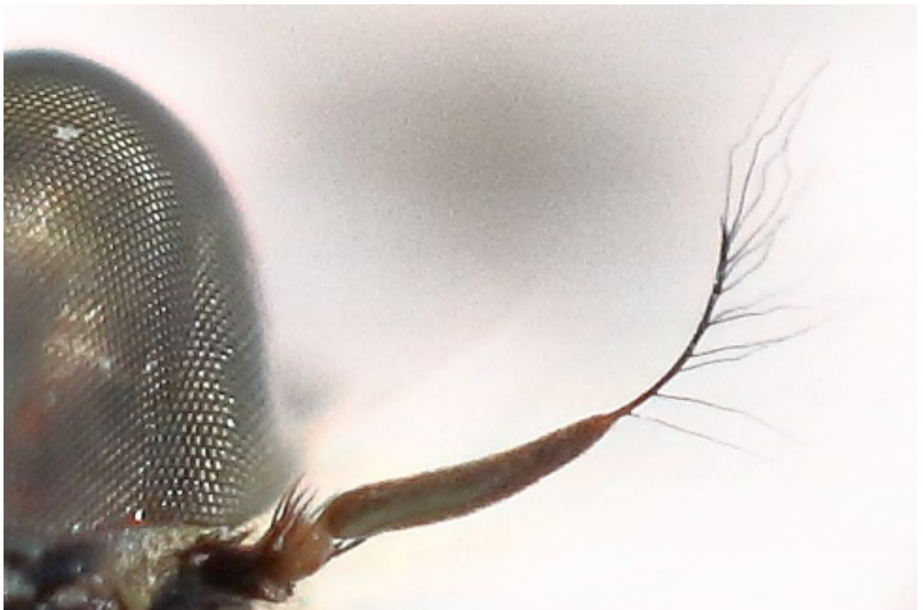
Figure 6 : Michotamia sp. nov. détail de l'antenne