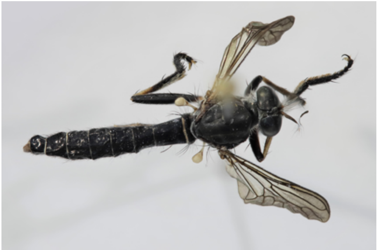
Figure 5 : Michotamia sp. nov. en vue dorsale