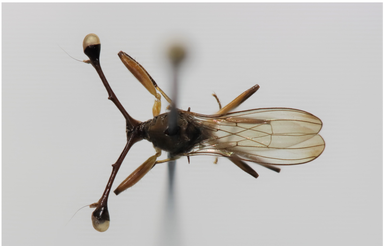
Figure 9 : Diasemopsis villiersi Séguy 1955

Lindner (1962) a désigné cette espèce comme synonyme de Diasemopsis conjuncta Curran 1931. Il n'a cependant pas examiné le type de villiersi , lequel a été vu par les Feijen qui confirment la validité de l'espèce (Feijen, communication personnelle : So Diasemopsis villiersi is a correct name. The synonymy proposed by Lindner and followed by Cogan & Shillito (1980) is rejected. Steyskal (1972) completely forgot Dias. villiersi in his catalogue. We examined the type of villiersi in Paris.