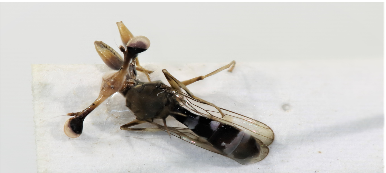
Figure 8 : Trichodiopsis exquisita (Brunetti 1928)

Matériel : 1♂, Ivory Coast, Man, Mt Tonkoui, 07°27'N 07°38'14''W, 1200m, 7-14.VII.2019, Y. Braet & A. Gué.