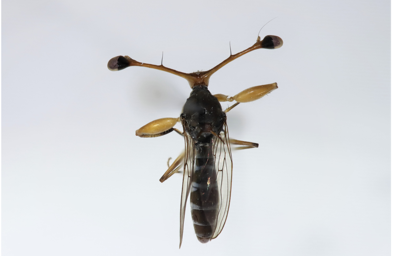
Figure 12 : Diasemopsis thaxteri species-group

Matériel : 1♀, Ivory Coast, Man, Mt Tonkoui, 07°27'N 07°38'14''W, 1200m, 14-21.X.2018, Y. Braet & A. Gué.