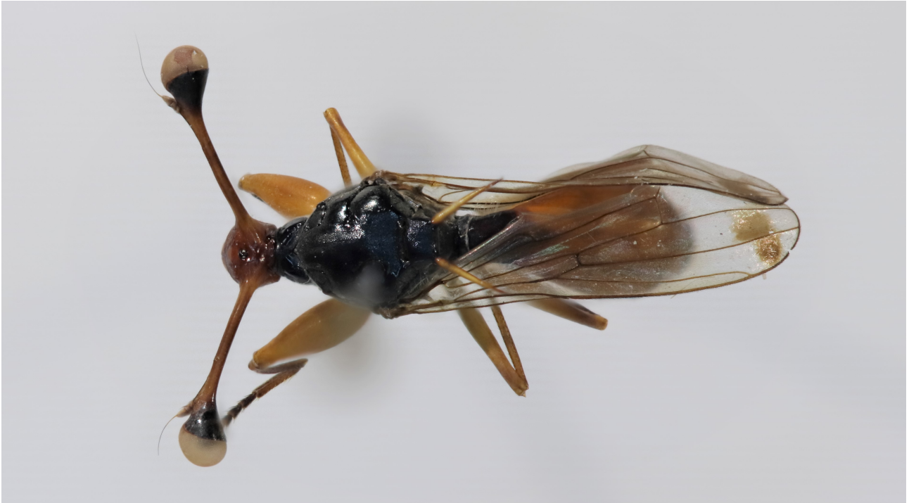
Figure 13 : Diopsis ichneumonea species-group