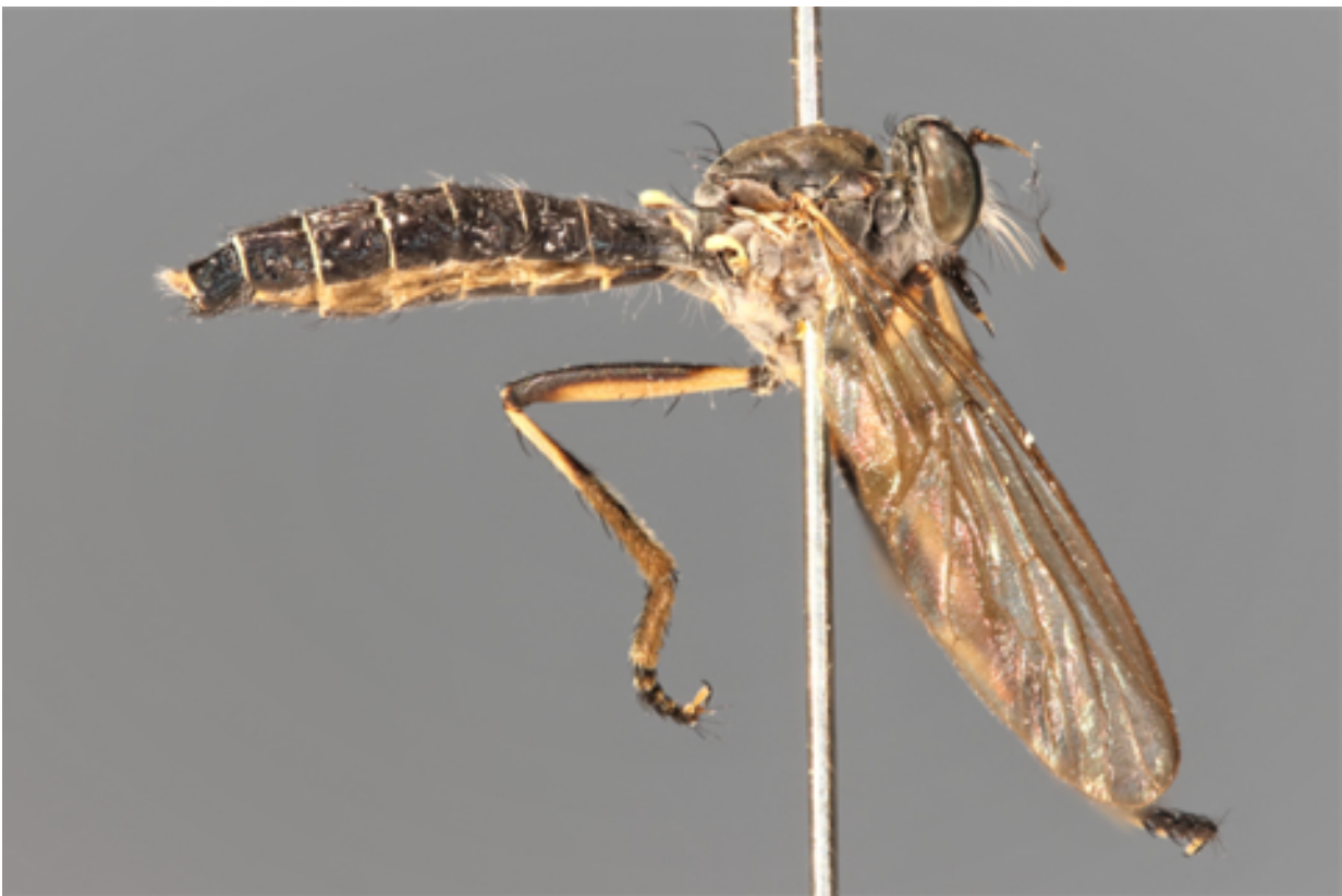
Figure 4 : Michotamia sp. nov. en vue latérale

Remarque : Aucun Michotamia n'a pour l'instant été observé en Afrique (Scarborough, 2010). Le post-pédicelle plus de deux fois plus long que le scape et le pédicelle réunis semble indiquer une première observation sur le continent africain. Malheureusement, nous n'avons pour étude qu'un exemplaire femelle et seule une étude des genitalia d'un mâle pourra confirmer ou infirmer l'appartenance au genre. Dans l'attente, nous préférons ne pas nommer cette nouvelle espèce.