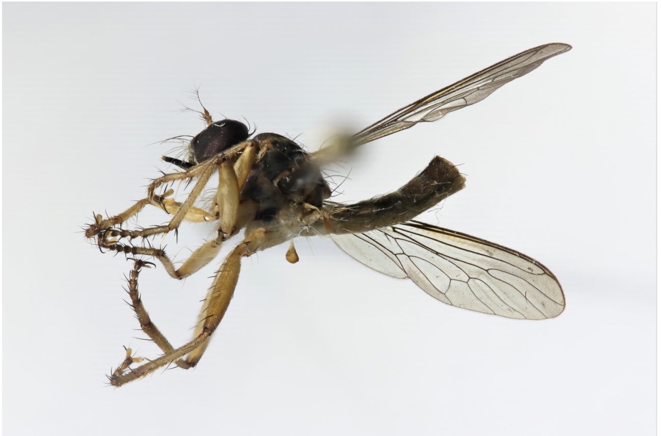
Figure 2 : Ommatius tonkouii sp.nov.

Paratypes : 1♂, 4.X.2019 ; 1♀, 18-25.XI.2018 ; 1♀, 19-26.V.2019 ; 1♀, 15-22.IX.2019 - piège Malaise, rec. Y. Braet & A. Gué.