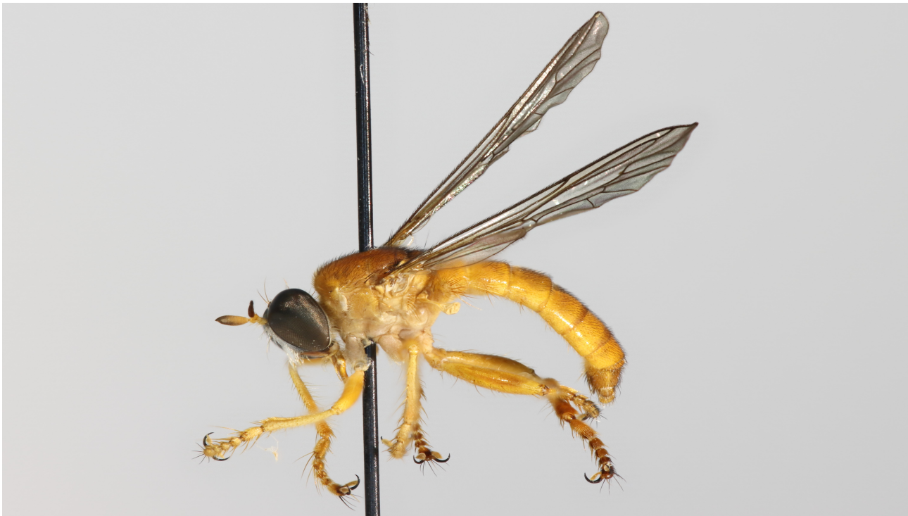
Figure 1 : Smeryngolaphria bromleyi Londt 1989 ♂

Matériel : 1♂, 20-27.X.2019, rec. Y. Braet & A. Gué