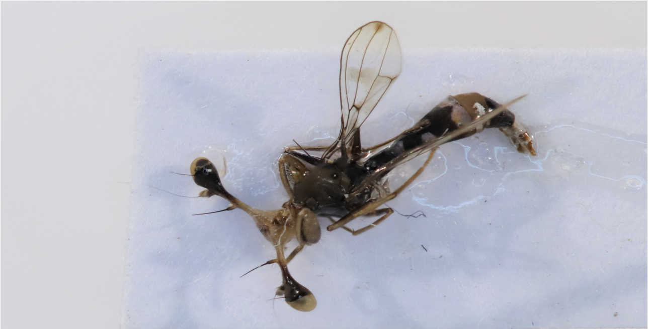
Figure 7 : Trichodiopsis pulchella (Eggers 1916)

Matériel : 1♀, Ivory Coast, Man, Mt Tonkoui, 07°27'N 07°38'14''W, 1200m, 16-23.IX.2018, Y. Braet & A. Gué