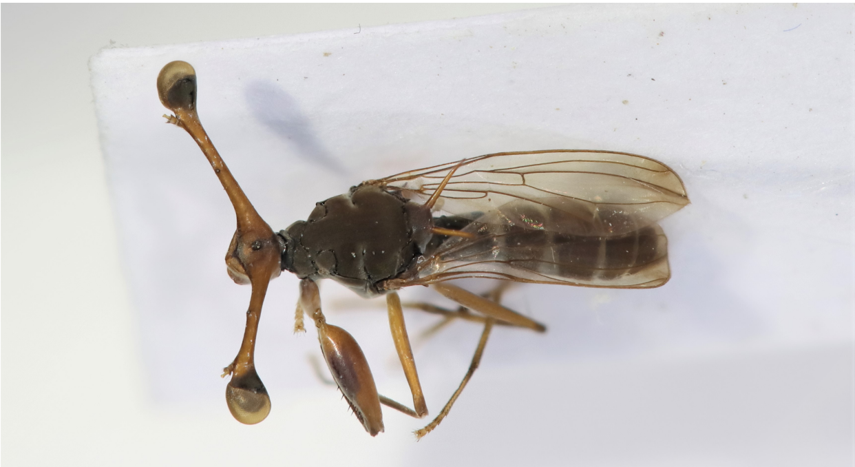
Figure 11 : Diasemopsis silvatica Eggers 1916

Matériel : 1♂, Ivory Coast, Man, Mt Tonkoui, 07°27'N 07°38'14''W, 1200m, 15-22.IX.2019, Y. Braet & A. Gué