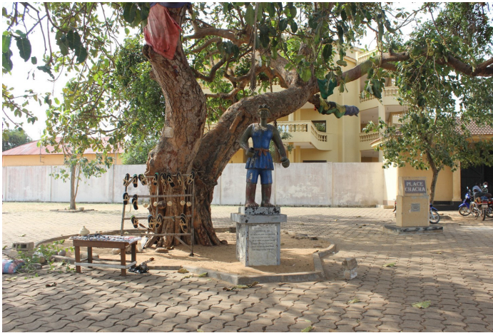
Figure 2. « Place des enchères » de Ouidah.

Au premier plan se trouve la statue représentant une amazone, réalisée par le plasticien Cyprien TOKOUDAGBA. Les objets qui étaient placés dans ses mains ont disparu. L'espace est investi par des supports marchands. Sur l'arbre, quelques drapeaux, installés en 2012 par Edwige APLOGAN, sont encore présents. En arrière plan, la stèle commémorative en l'honneur de Chacha est visible, surplombée par la demeure des héritiers du commerçant brésilien.