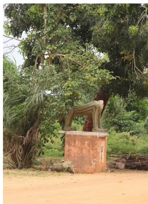
Figure 4. Statue détériorée, réalisée par Cyprien TOKOUDAGBA en 1993. Photo : Rossila Goussanou, janvier 2015

Figure 3. Transformation des colonnes de la « Porte du Non-Retour » (réalisée par Fortuné BANDEIRA et Yves KPEDE) en un espace mercantile. Photo : Rossila Goussanou, février 2017.