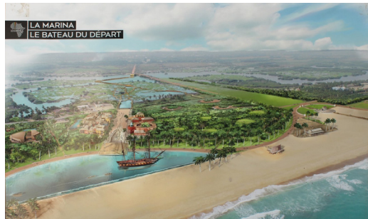
Cette projection est affichée sur la devanture de l'Agence Nationale en charge du projet (ANPT), à Cotonou. Photographie : Rossila Goussanou, mars 2018.