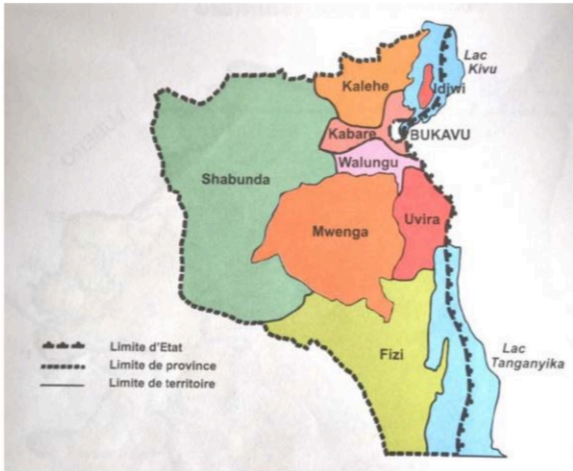
Carte 1. Le territoire de Mwenga dans la province du Sud-Kivu