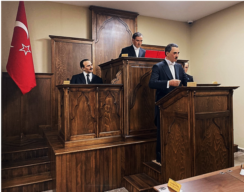
Figure 2. Reconstitution partielle de l'Assemblée de la République de Hatay avec des statues de Abulgani Türkmen, Bedi Munir Karabay et Tayfur Sökmen (sur la photographie), Isa Kazancıyan, Basil Huri et d'autres, 22 août 2022 © Verda Kimyonok.

À l'entrée du musée, la citation « Quarante siècles de patrie turque ne peuvent rester captifs aux mains de l'ennemi ! » 10 situe le visiteur cent ans en arrière, dans le Hatay meselesi 11 . Les années 1920 à 1940 de même que 2022 présentent au moins un point commun : elles réutilisent les éléments historiques et culturels de Hatay comme représentation de la modernité turque à l'échelle internationale. L'effort fourni par la jeune République pour sa reconnaissance et sa place au sein de la diplomatie internationale 12 lui permet la légitimation progressive de sa présence sur le territoire hatayien. Ainsi, l'acquisition des organes et symboles propres à un pouvoir légiférant par la République de Hatay à partir de 1937 fait partie de ce large processus. L'Assemblée, la Constitution, les élections par vote, le mühür , l'état civil exposés dans la dernière salle du musée sont autant de traces de la modernisation de la région. Une modernité « à la française », embellie par la présence d'hommes politiques locaux aux appartenances ethno-confessionnelles variées comme représentants de la population (figure 2).