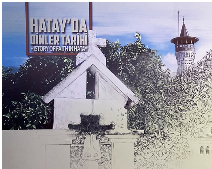
Figure 3. L'« Histoire des croyances à Hatay » dans le Musée de la Ville d'Antakya © Verda Kimyonok.

L'insistance sur la « tolérance » peut être lue comme une stratégie politique au service de la candidature à l'intégration de l'UE et du secteur touristique dans un contexte de crise économique et sécuritaire. Ainsi, malgré une certaine ouverture stratégique de l'AKP envers les minorités à partir de 2013, de nombreuses recherches montrent la fragilisation extrême, voire une « ségrégation socio-spatiale » 18 de ces mêmes minorités 19 . Car l'« approche favorable à la religion de l'AKP, bien que flexible, est en fin de compte fondée sur la supériorité de l'Islam et reste donc limitée » 20 . Au coin de cette salle principale, sans relation avec le territoire, des panneaux « collecte du Coran » semblent simplement faire écho à l'omission totale des croyances et pratiques locales souvent syncrétiques de cette communauté, considérées comme hérétiques par certaines interprétations de la sunna orthodoxe.