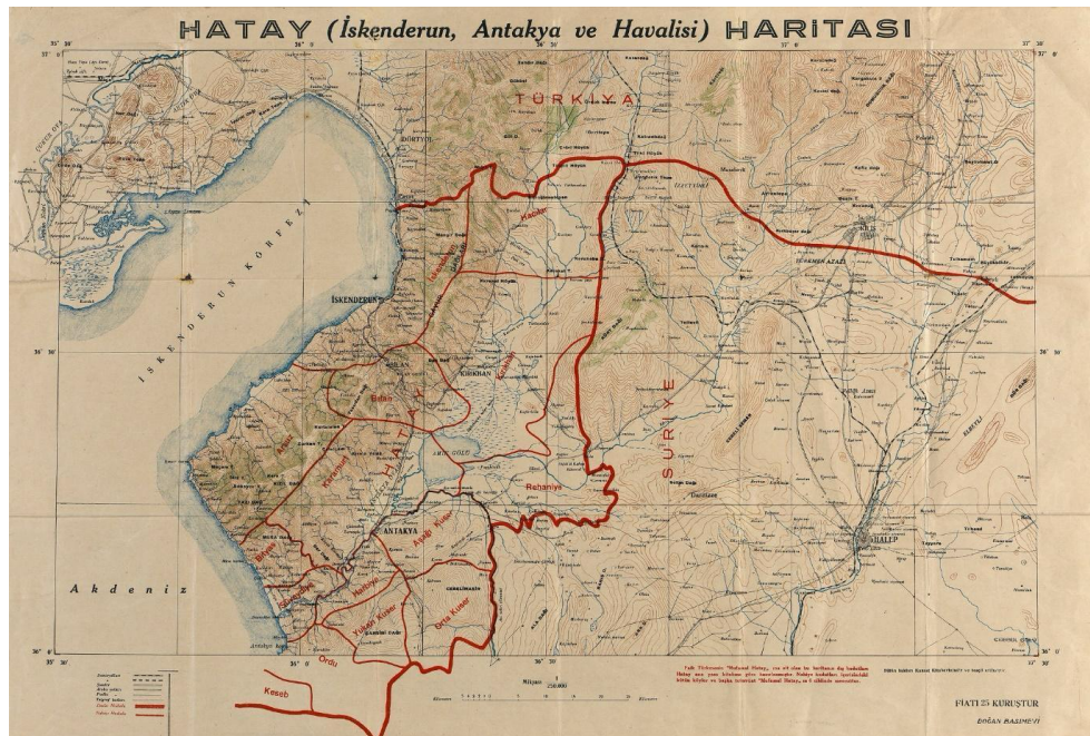
Carte 1. A. Faik Türkmén, Mufasssal « Hatay. Cografya'si ve Edebiyat », Cumhuriyet Matbaası, İstanbul, 1937.

les çete (milices) de village en village pour diviser et gagner en pouvoir dans le nord du vilayet syrien d'Alep.