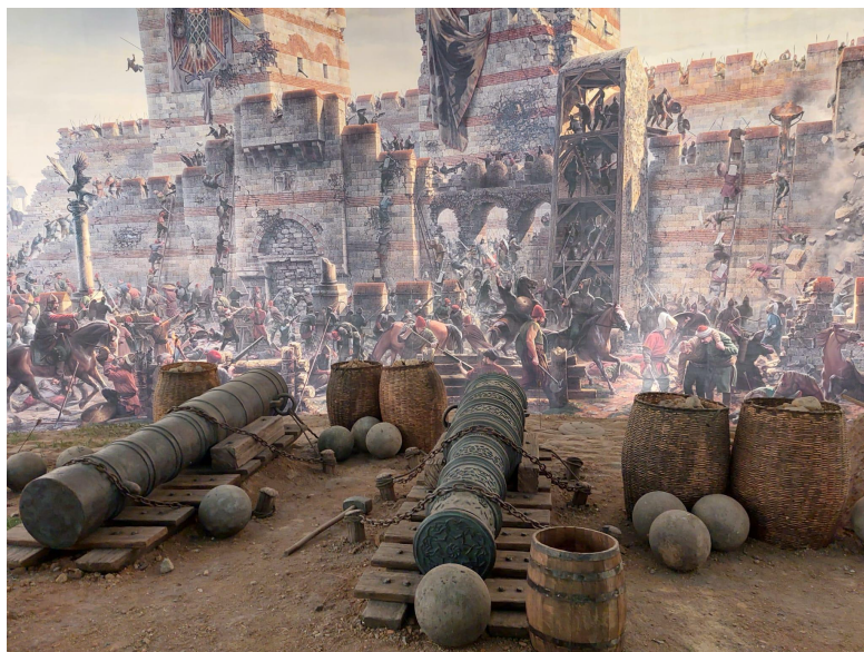
Figure 5. La projection et l'installation © Julie Alev Dilmaç.

En pénétrant dans la rotonde, le visiteur est immédiatement immergé au cœur de la bataille de la Conquête, entouré de canons et face à un décor de fortifications qui l'enveloppe à 360 degrés. Sur la fresque sont représentés Mehmet le Conquérant, ses soldats et les Murailles de la ville. Des sons d'épées qui s'entrechoquent et des cris renforcent l'immersion. Après quelques minutes, une vidéo retraçant le siège de Constantinople est projetée directement sur la coupole du dispositif : l'histoire de la Conquête est une nouvelle fois narrée, ou plutôt exposée, car très peu de commentaires viennent enrichir les images. Le but est de faire du visiteur un « témoin » privilégié de l'assaut – un terme récurrent sur le site du musée – le plaçant ainsi au centre même de l'Histoire.