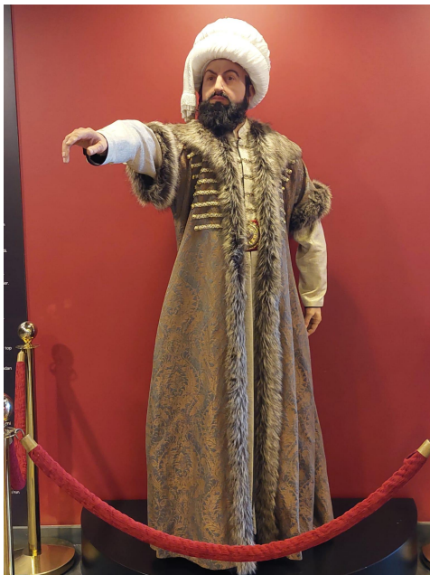
Figure 2. Mehmet le Conquérant © Julie Alev Dilmaç.

Le musée, réparti sur plusieurs étages, expose des représentations de l'Empire ottoman à travers de longs panneaux explicatifs en turc et des miniatures artistiques. En d'autres termes, l'Histoire y est racontée uniquement via des reproductions de tableaux, des photographies de caftans et des répliques de canons, dont l'authenticité n'est jamais certifiée. Cela pose la question de la pertinence d'un tel musée, surtout en l'absence de validation scientifique du récit proposé.