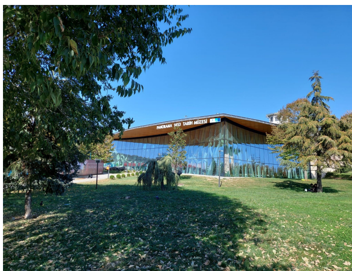
Figure 1. Le musée historique Panorama 1453 © Julie Alev Dilmaç.

Dans cet article, il s'agira d'analyser les récits sur l'Empire ottoman présents au Musée Panorama 1453, de décrire les moyens employés pour mettre en scène la Conquête de Constantinople et de voir si ce récit s'aligne sur les enjeux du projet politique actuel. Nous nous pencherons également sur les raisons motivant la construction de ce musée à cet emplacement et sur le choix de l'expérience immersive du panorama. L'argument central est que ce musée utilise diverses stratégies discursives (panorama, panneaux explicatifs, mises en scène, divertissement, glorification du passé...) pour plonger le visiteur dans une représentation idéalisée de l'Empire ottoman, afin qu'il s'y identifie et y adhère. L'objectif est de créer une continuité entre l'histoire impériale et le projet politique du parti de la Justice et du Développement (PJD). De plus, les nouveaux musées en Turquie privilégiant l'expérience immersive constituent un nouveau type de « lieux de mémoire », à savoir des espaces où les individus confrontent le passé au présent et communient autour de récits qui les relient à une histoire commune 13 . Ainsi, les citoyens deviennent des acteurs de la diffusion de l'histoire impériale, plutôt que de simples récepteurs passifs d'un projet qui leur serait imposé.