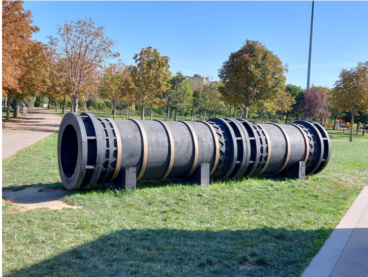
Figure 4. Canon exposé à l'extérieur du musée © Julie Alev Dilmaç.

Mehmet II est surtout renommé pour le caractère spectaculaire de son combat lors de la Conquête. En plus d'utiliser les plus gros canons jamais vus, il ordonna à ses troupes de transporter des navires de guerre par-dessus la colline où se trouve aujourd'hui la place Taksim, jusqu'à l'entrée de la Corne d'Or, afin de contourner la chaîne défensive qui protégeait la ville des attaques navales. Cette stratégie audacieuse est illustrée dans le musée par des fresques murales qui accompagnent les visiteurs, notamment le long des escaliers, créant l'illusion de passer du niveau de la mer à l'intérieur des galères. Cependant, malgré le caractère spectaculaire de cette manœuvre, peu d'éléments y font référence : seules une modeste maquette de bateau et quelques panneaux explicatifs soutiennent cette légende.