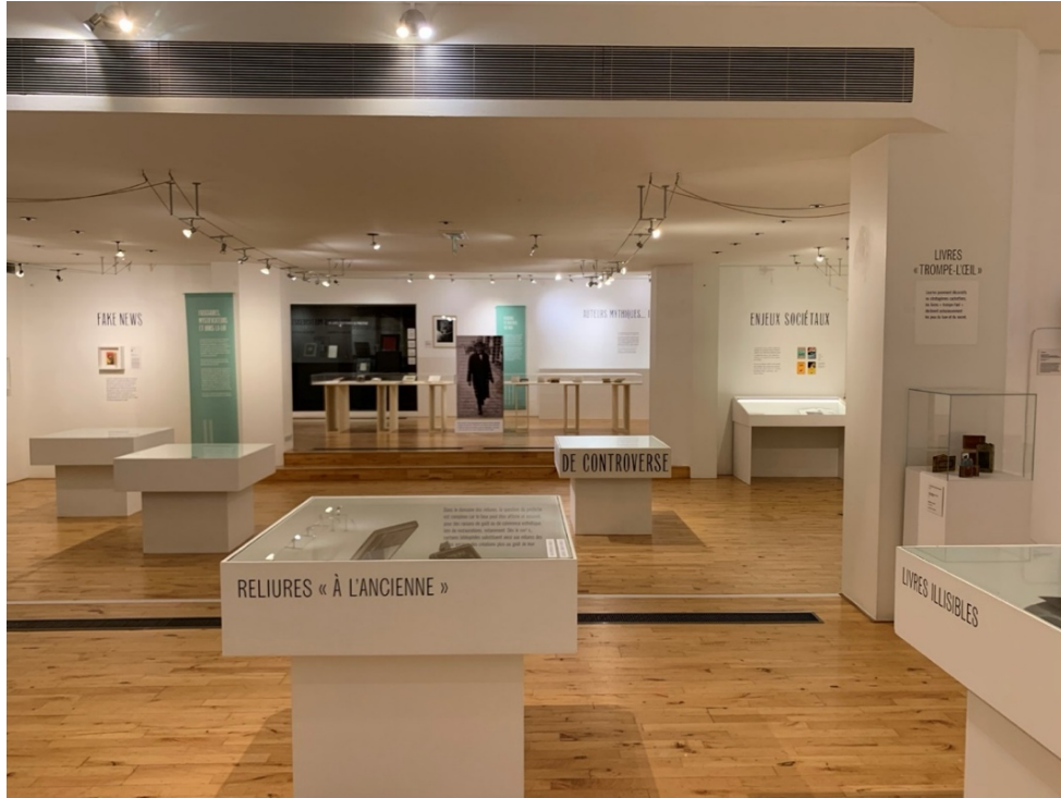
Figure 5. Vue de l'exposition L'Atelier du faux , Bruxelles, Wittrockiana, 2025 © David Martens.