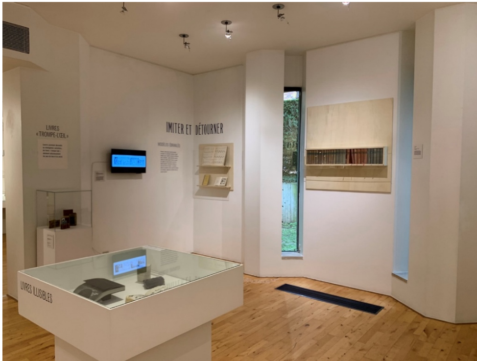
Figure 6. Vue de l'exposition L'Atelier du faux , Bruxelles, Wittrockiana, 2025 © David Martens.