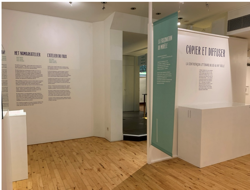
Figure 4. Vue de l'exposition L'Atelier du faux , Bruxelles, Wittockiana, 2025 © David Martens.