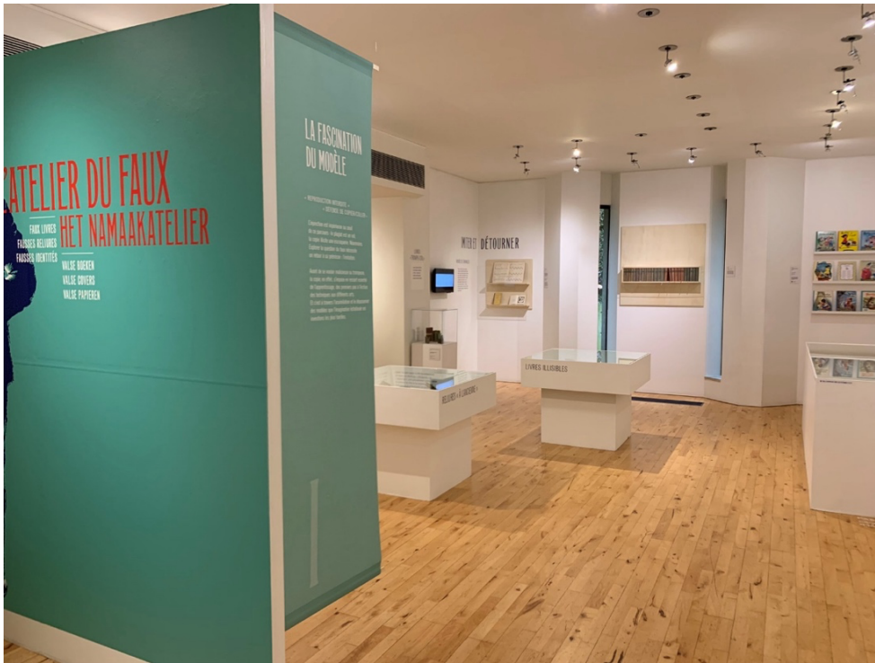
Figure 3. Vue de l'exposition L'Atelier du faux , Bruxelles, Wittockiana, 2025 © David Martens.