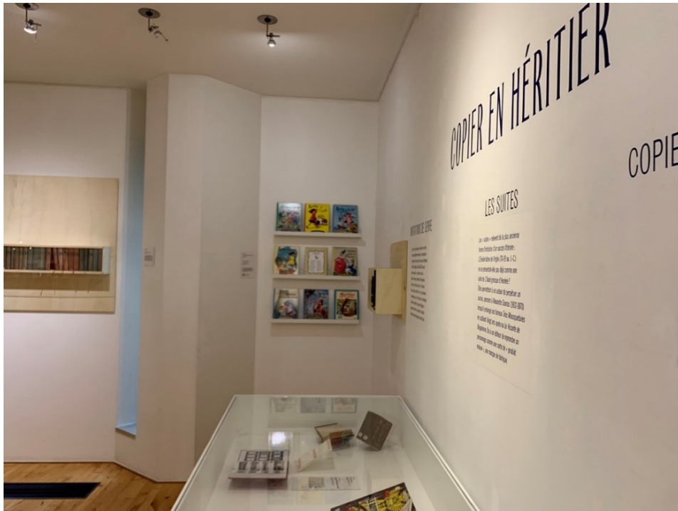
Figure 7. Vue de l'exposition L'Atelier du faux , Bruxelles, Wittockiana, 2025 © David Martens.

L'opération est répétée pour chacun des murs de la salle, puis pour chacune des salles de l'exposition. Ainsi en va-t-il, à titre d'exemple, de la saisie du centre à partir duquel sont prises les photographies précédentes (sans la prise de vues des vitrines, dans leur globalité, ainsi qu'avec une focalisation sur les différentes pièces et les cartels qui les présentent).