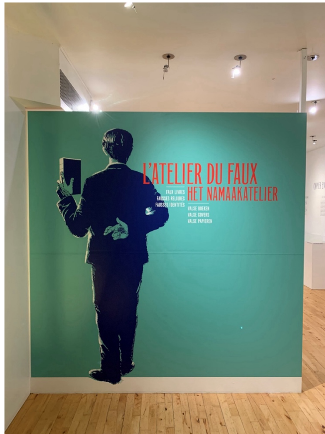
Figure 2. Vue de l'exposition L'Atelier du faux , Bruxelles, Wittockiana, 2025 © David Martens.

Et voici une sélection d'images donnant à voir l'entrée et la première salle de l'exposition L'Atelier du faux , présentée entre octobre 2024 et janvier 2025 à la Bibliotheca Wittockiana, à Bruxelles. Les images montrent tout d'abord l'entrée de l'exposition, puis plusieurs vues se succèdent, depuis quatre angles de vue pris depuis le mur à main droite à l'entrée de la première salle (l'opérateur se place juste devant la vitrine accolée au mur en question). Dans un second temps, l'opérateur s'est placé en face du mur (et de la vitrine qui étaient initialement situés dans son dos) – pour limiter le nombre d'images dans le présent article, le texte d'introduction de l'exposition et la première vitrine n'ont pas été reproduites ici –, de façon à permettre une vue en plan large de la partie centrale de ce même mur, puis un plan plus rapproché des expôts présentés, et enfin la teneur de la vitrine. Ces images (toutes dues à D. Martens, plutôt de l'école consistant à se placer de façon centrale par rapport aux murs de salle) sont précédées par un plan de l'espace d'exposition (il n'y a pas eu de plan de scénographie pour cette exposition).