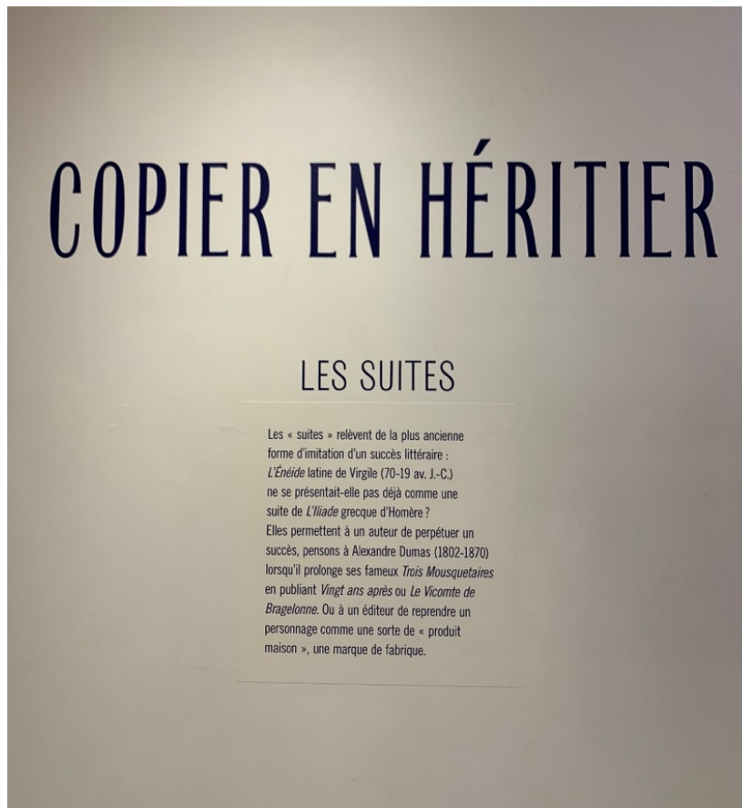
Figure 10. Vue de l'exposition L'Atelier du faux , Bruxelles, Witttockiana, 2025 © David Martens.