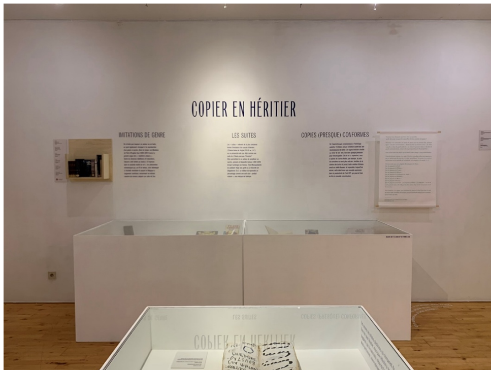
Figure 8. Vue de l'exposition L'Atelier du faux , Bruxelles, Wittockiana, 2025 © David Martens.

L'opération est répétée pour chacun des murs de la salle, puis pour chacune des salles de l'exposition. Ainsi en va-t-il, à titre d'exemple, de la saisie du centre à partir duquel sont prises les photographies précédentes (sans la prise de vues des vitrines, dans leur globalité, ainsi qu'avec une focalisation sur les différentes pièces et les cartels qui les présentent).