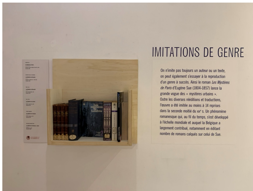
Figure 11. Vue de l'exposition L'Atelier du faux , Bruxelles, Wittockiana, 2025 © David Martens.

Certains problèmes sont susceptibles d'être rencontrés par les opérateurs, qui pourraient compromettre ou, du moins, relativiser les ambitions de ce protocole.