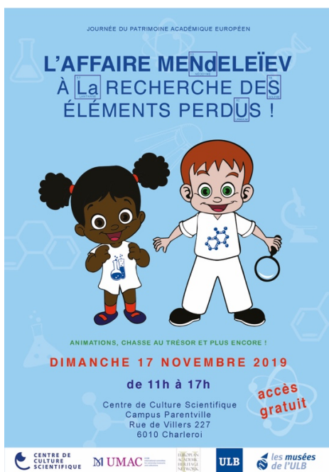
Figure 4 - Visuel de l'édition 2019 de la Journée du Patrimoine académique européen. Conception : Lucie Sanou.

Depuis novembre 2018, quatre groupes d'étudiantes mènent trois micro-projets et un macro-projet directement liés au Réseau des Musées de l'ULB. Le premier micro-projet consistait en l'organisation de la journée d'activités gratuites programmée au Centre de Culture scientifique (Charleroi) le 17 novembre 2019, dans le cadre de la Journée du patrimoine académique européen (fig. 4). Cinq étudiantes étaient impliquées 18 et ont mis au point, avec les membres du Réseau, un programme d'activités pour la journée, tout en assurant l'ensemble de l'organisation logistique et de la promotion de l'événement sous la supervision de la Coordination (fig. 5).