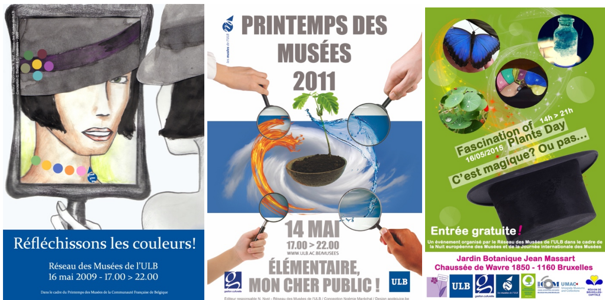
Figures 1 - Affiche de l'édition 2009 du Printemps des Musées .

D'autres manifestations sont également mises sur pied avec l'assistance de stagiaires, qui participent à l'ensemble du processus, depuis la définition du thème jusqu'au déroulement de l'événement, en passant par la conception de l'affiche, du programme, la promotion et ses supports, les aspects logistiques, etc. Ainsi, lors de différentes éditions du Printemps des Musées (fig. 1 & 2), du Fascination of Plants Day (fig. 3), de la Journée du Patrimoine académique européen et de la Journée internationale des Musées/Nuit européenne des Musées , comme pour la Museum Night Fever (6 mars 2010), les étudiants ont contribué à l'ensemble du processus.