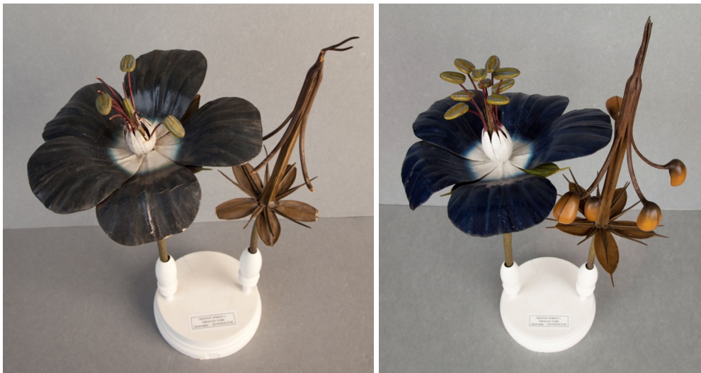
Figures 7-8 - Géranium livide, avant et après traitement - Restauration réalisée par Sophie Kirkpatrick, Clara Montero, Valentine Vanlieffland et Delphine Rosier (BA3), sous la supervision de Marianne Decroly, ENSAV - La Cambre.

Le second exemple est constitué par cinq modèles botaniques Brendel 25 (1898-1927) de la collection du Jardin botanique. Menées en 2015-2016, l'étude des collections a été confiée à des étudiantes en HAA de l'ULB, tandis que les restaurations ont été assurées par des étudiantes en conservation-restauration d'œuvres d'art - sculptures à l'ENSAV-La Cambre (fig. 7 & 8).