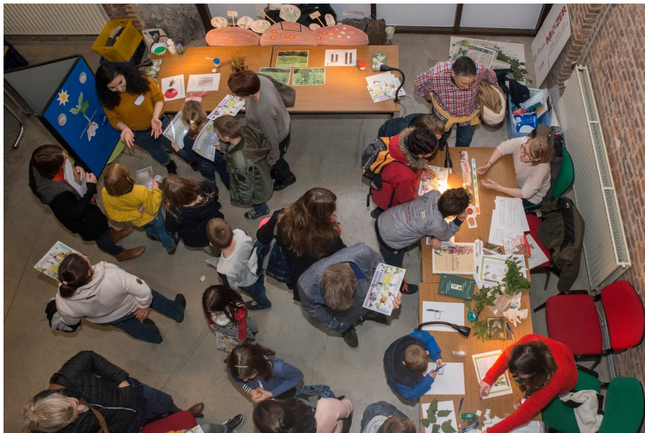
Figure 5 - Journée du Patrimoine académique européen, Centre de Culture Scientifique de l'ULB, 17 novembre 2019.

Enfin, le macro-projet, également conduit par cinq étudiantes 21 , n'était rien moins que l'organisation, du 21 au 26 juin 2020, de la conférence annuelle et internationale d'UNIVERSEUM, sous la supervision du Réseau des Musées de l'ULB et de la KU Leuven. Dès la prise de décision, le 20 mars, d'annuler la conférence en 2020 et de la reporter en 2022, les étudiantes ont réfléchi à une formule alternative pour finaliser leur projet. Elles ont choisi de réunir, autour du thème Beyond museum visits in the era of COVID19: 5 min meeting with university museum workers , un maximum de petites vidéos dans lesquelles les professionnels du monde muséal universitaire sont invités à évoquer les problèmes, limites et contraintes rencontrés par leur musée ou collection après plusieurs semaines de confinement et de fermeture et dans une perspective de réouverture progressive. L'ensemble des vidéos collectées a été mis en ligne à la date du 21 juin 2020, ce qui n'empêche pas que le site 22 s'enrichisse d'autres contributions par la suite.