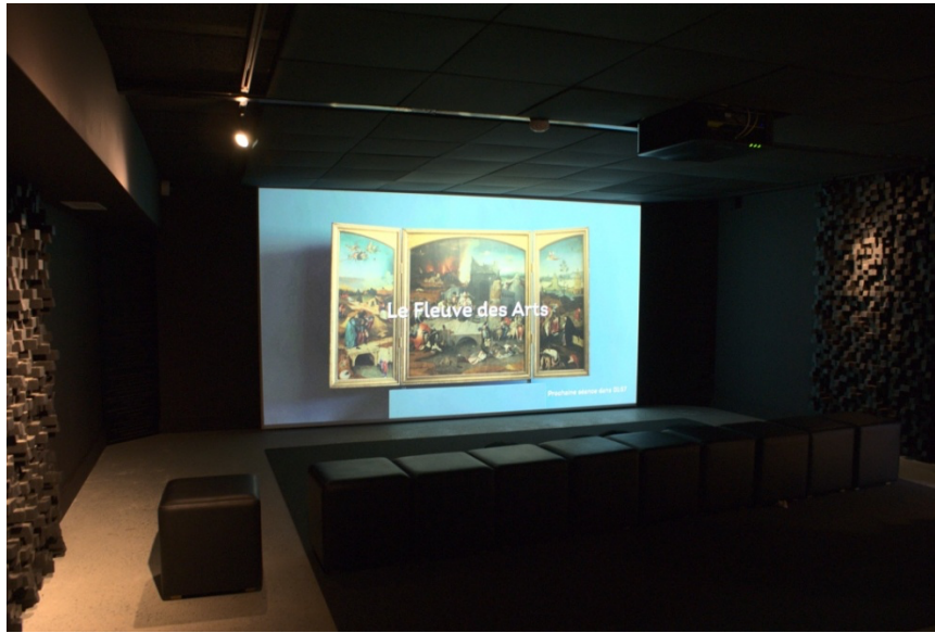
Figure10 - Salle de projection du film d'animation Le Fleuve des Arts du Mudia, 24 février 2020.

À la fin du parcours, les visiteurs ont l'occasion de prendre place dans un Photomaton qui transformera leur portrait en œuvres d'art en y appliquant des sortes de filtres artistiques (par exemple pointilliste).