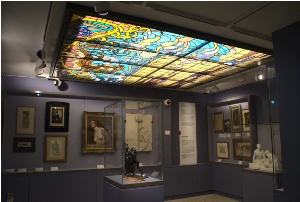
Figure 5 - Salle dédiée à l'Art nouveau, avec le vitrail d'Henri Privat-Livemont au Mudia, 24 février 2020.

Pour poursuivre la visite, les visiteurs doivent ensuite emprunter les escaliers ou l'ascenseur afin de se rendre au niveau 1 ; la première salle de l'étage aborde le Romantisme et le Réalisme social, avec notamment Honoré Daumier et une activité autour d'une vingtaine de petites sculptures réalisées par l'artiste et caricaturant des personnalités de son époque ; la salle suivante emmène les visiteurs à la découverte du Symbolisme et de l'Art nouveau, avec comme œuvre-phare de cette partie un vitrail original réalisé par Henri Privat-Livemont (fig. 5).