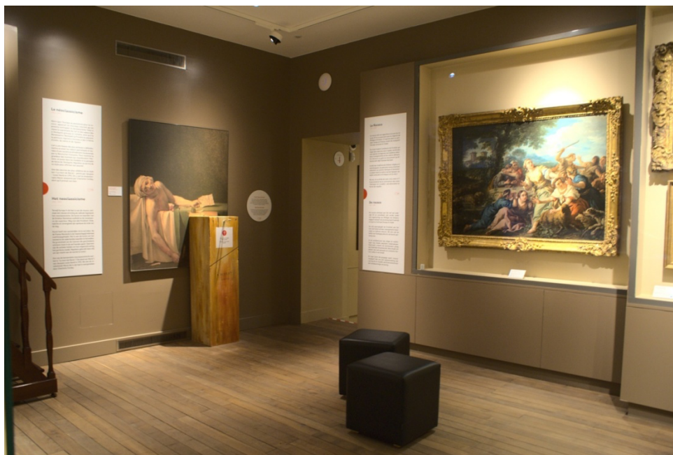
Figure 4 - Salle dédiée au Rococo, au Classicisme et au Néoclassicisme dans le musée Mudia, 24 février 2020.

En quittant cette première salle, les visiteurs traversent un petit couloir dans lequel ils peuvent apercevoir, derrière une vitrine, une série de terres cuites baroques datant de la seconde moitié du XVII e siècle. La visite se poursuit ensuite par la seconde salle, dédiée au Caravagisme. Celle-ci présente notamment une Madeleine pénitente originale de la première femme artiste peintre connue, Artemisia Gentileschi, ainsi qu'un film consacré à la vie et à l'œuvre de l'artiste. La salle suivante est vouée à la nature morte et à la peinture de genre. Enfin, la dernière pièce du niveau zéro initie les visiteurs au Rococo, au Classicisme et au Néoclassicisme (fig. 4).