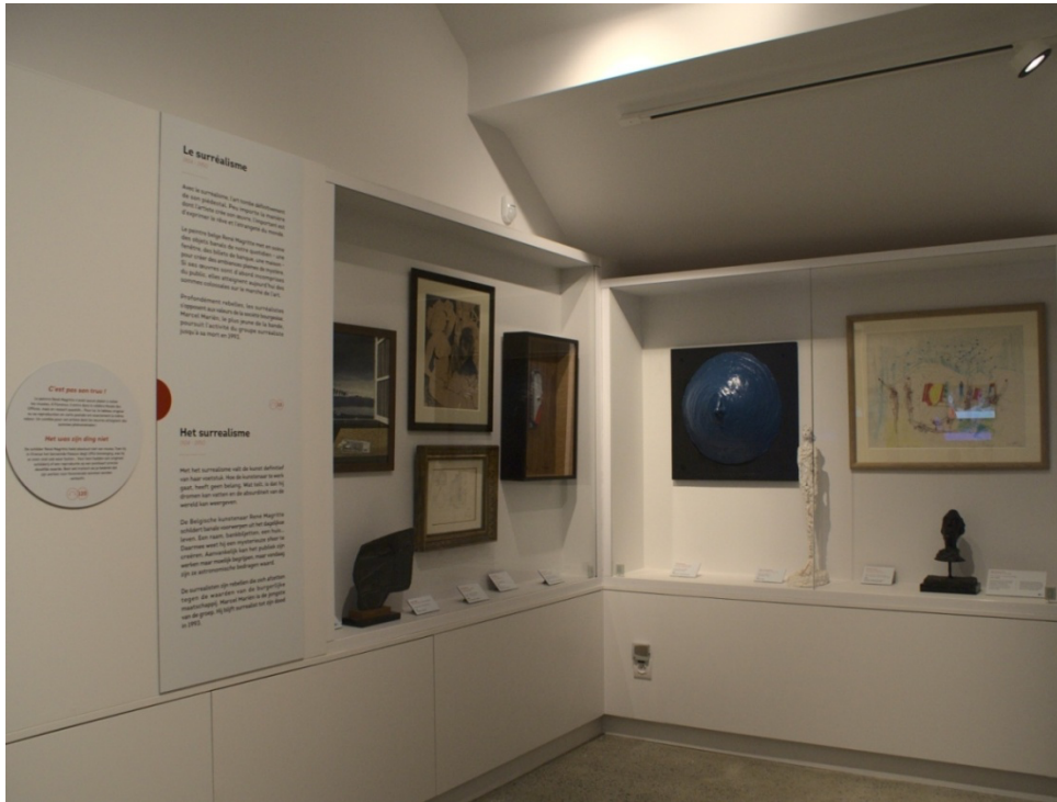
Figure 8 - Une partie de la collection surréaliste du Mudia, 24 février 2020.

Une fois arrivé au dernier niveau, le parcours se poursuit avec une salle dédiée à l'Art déco, à l'abstraction lyrique et aux courants plus régionaux que sont Nervia et le Naturalisme ardennais. Après la traversée d'un couloir dédié à l'artiste anversois Panamarenko, à l'Art brut, à CoBrA et au Pop Art, la visite se poursuit par la (re)découverte de la Nouvelle figuration, de la Nouvelle subjectivité et de l'Art conceptuel.