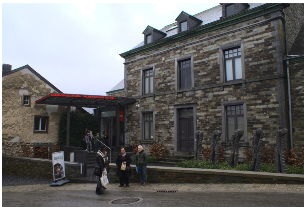
Figure 1 - Extérieur du musée, l’ancienne maison ainsi que le nouveau sas d’entrée, 24 février 2020.

C’est donc sur fonds propres que le Mudia a été créé, rejoignant ainsi la liste des musées privés présents sur le territoire belge. Déjà réputé pour être le « Village du Livre », Redu a été choisi pour devenir l’écritoire du projet du couple Noulet. C’est là qu’il a acquis en 2015 un ancien presbytère du XIX e siècle (MUDIA 2018 ; LA GRANGE ATELIER ARCHITECTURE 2018 ; SONON, s. d. B). Le projet du musée a été confié à La Grange, bureau d’architecture de Libramont.