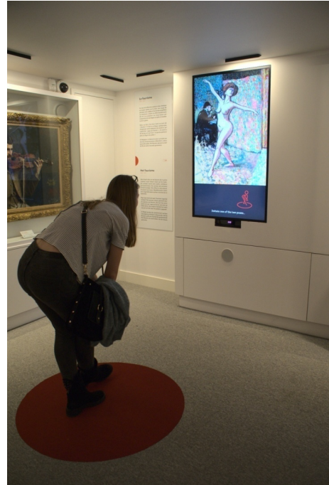
Figure 7 - Version interactive du tableau Matisse dans l'atelier de Manguin d'Albert Marquet au Mudia, 24 février 2020.

À l'étage supérieur, les visiteurs peuvent tout d'abord observer un jeu-machine à sous les initiant aux prix de vente de plusieurs œuvres célèbres, avant de passer à la première salle du niveau 2, consacrée à l'École de Pont-Aven et au Fauvisme. En plus des œuvres originales de Kees Van Dongen notamment, les visiteurs peuvent exécuter des mouvements de danse classique afin d'animer le tableau Matisse dans l'atelier de Manguin d'Albert Marquet (fig. 7).