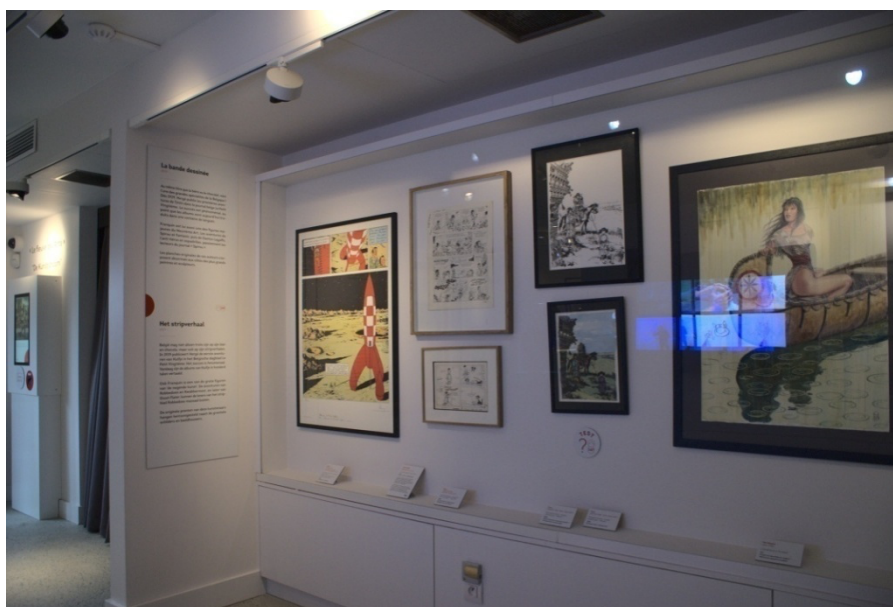
Figure 9 – Une partie de la collection bande-dessinée du Mudia, 24 février 2020.

Bien que ces explications puissent paraître trop simplistes et lacunaires pour des connaisseurs, leur clarté a néanmoins le mérite de permettre aux individus pour qui l'art est un monde inconnu de découvrir les courants et mouvements les plus difficiles à appréhender sans se sentir incultes et mis de côté. Pour avoir mené nos visites avec des proches sans connaissances approfondies en histoire de l'art, et pour avoir observé les familles avec enfants présentes sur place, nous pouvons avancer que cette simplification des notions s'avère être efficace. À noter également que tous les panneaux sont accompagnés de repères chronologiques pour une meilleure compréhension du parcours. Avant d'achever la visite du musée par deux parties dédiées respectivement à la bande-dessinée (fig. 9) et à la photographie, petits et grands ont le loisir de prendre place dans une petite salle de cinéma confortable afin d'assister à la projection du Fleuve des Arts (fig. 10), film d'animation d'une dizaine de minutes créé exclusivement pour le musée et réalisé par le studio français AmaK (MUDIA 2018 ; STUDIO AMAK 2018 ; SONON s. d. A).