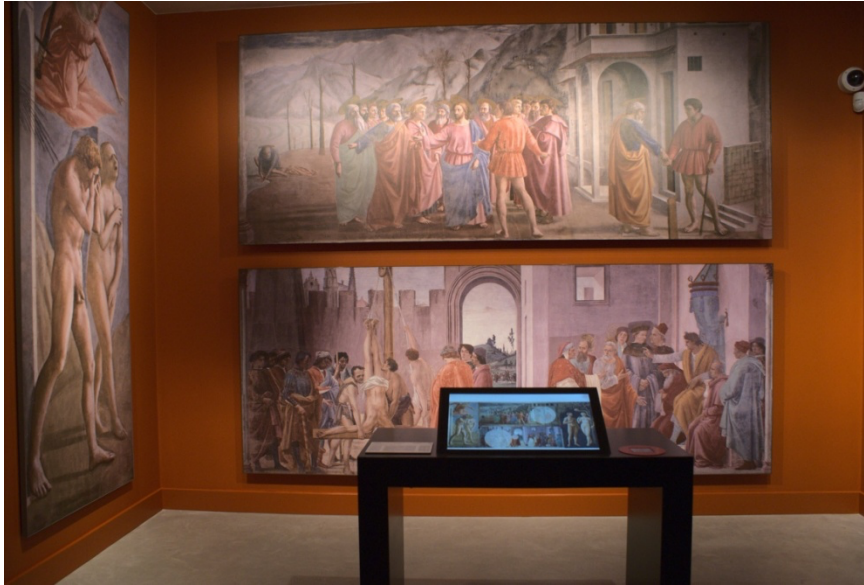
Figure 3 - Dispositif interactif de la fresque Adam et Ève chassés de l'Éden par Masaccio, Masolino et Lippi de la chapelle Brancacci à Florence, 24 février 2020.

En quittant cette première salle, les visiteurs traversent un petit couloir dans lequel ils peuvent apercevoir, derrière une vitrine, une série de terres cuites baroques datant de la seconde moitié du XVII e siècle. La visite se poursuit ensuite par la seconde salle, dédiée au Caravagisme. Celle-ci présente notamment une Madeleine pénitente originale de la première femme artiste peintre connue, Artemisia Gentileschi, ainsi qu'un film consacré à la vie et à l'œuvre de l'artiste. La salle suivante est vouée à la nature morte et à la peinture de genre. Enfin, la dernière pièce du niveau zéro initie les visiteurs au Rococo, au Classicisme et au Néoclassicisme (fig. 4).