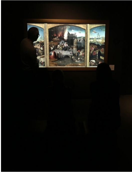
Figure 6 - Version interactive du triptyque La tentation de Saint Antoine de Jérôme Bosch au Mudia, 5 novembre 2019.