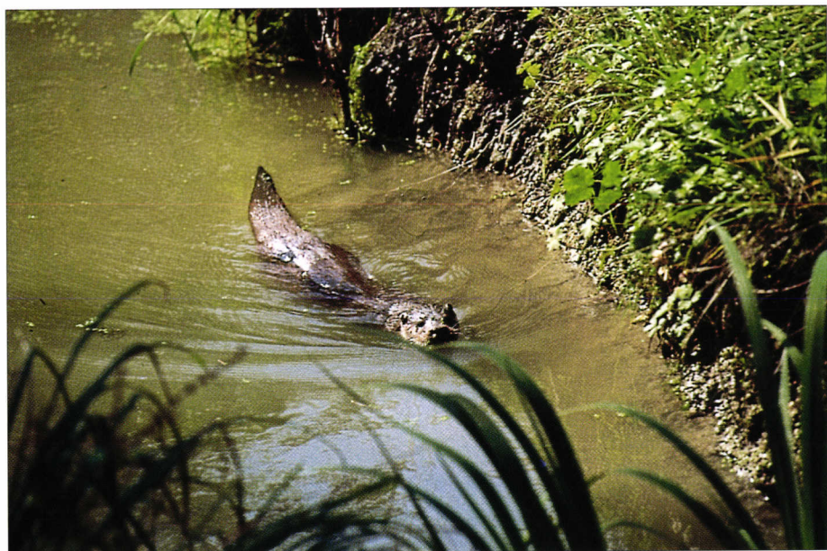
Loutre d'Europe. European otter.