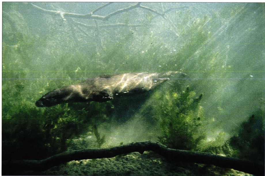
Loutre d'Europe en plongée. European otter diving.