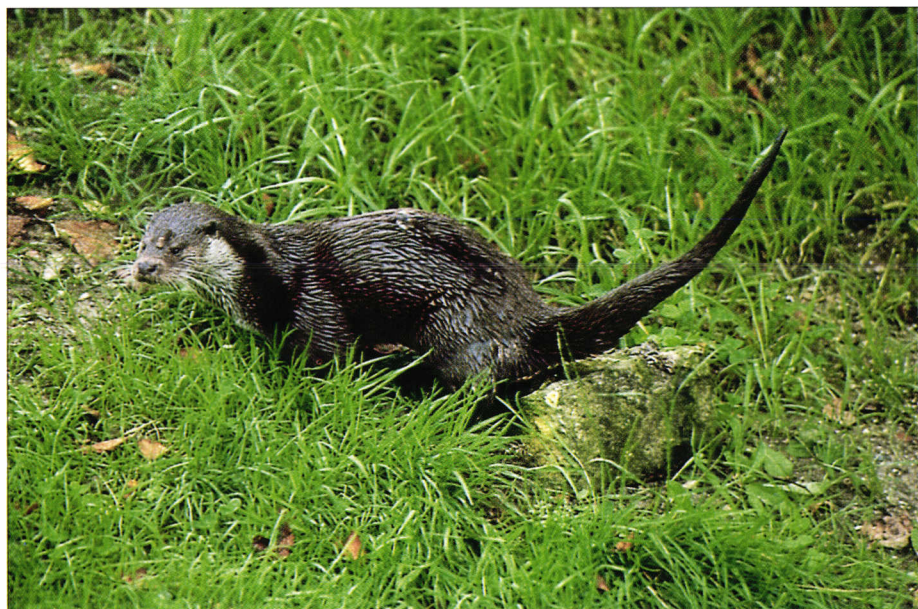
Loutre d'Europe déposant une épreinte. European otter sprainting.