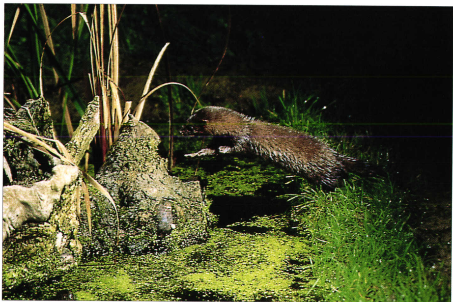
Vison d'Europe. European mink.