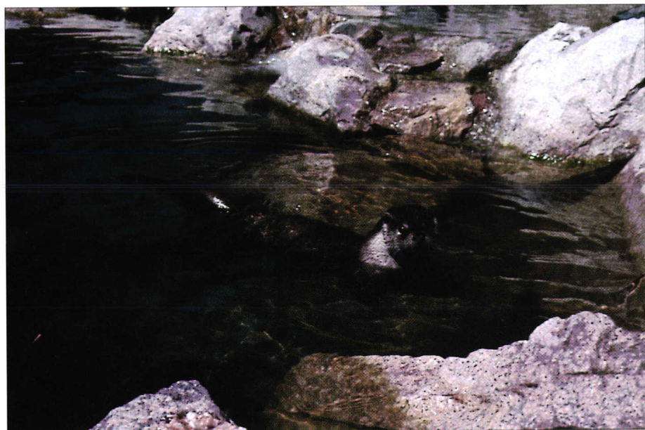
Loutre d'Europe. European otter.