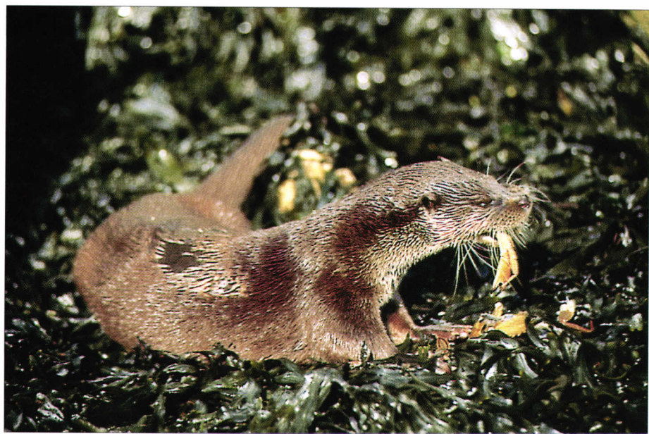
Loutre d'Europe mangeant un crabe (étrille). European otter eating a crab.