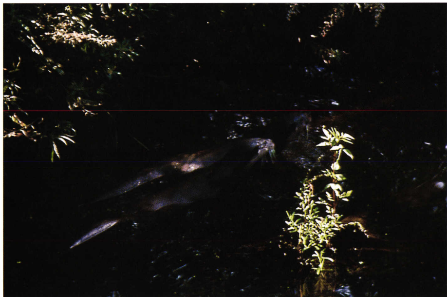
Loutre d'Europe. European otter.