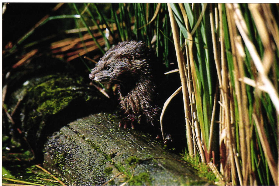
Vison d'Europe. European mink.