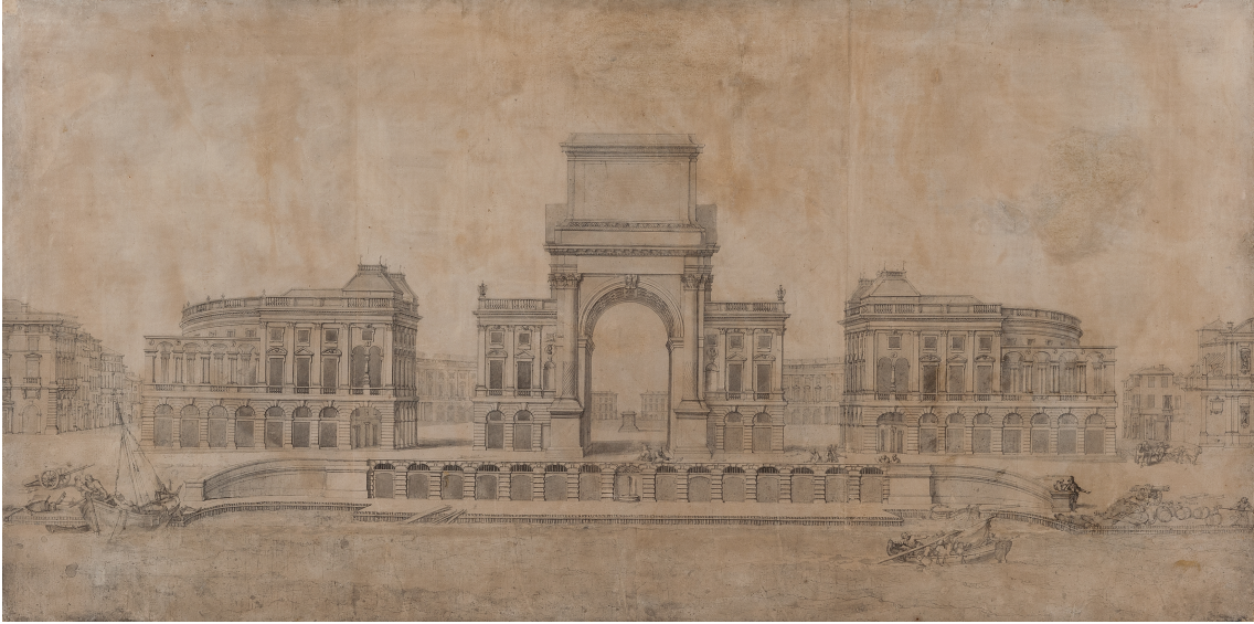
Illustration 5: Pierre Puget, Projet de place royale pour Marseille, Élévation perspective en regardant vers la ville [plume et lavis gris], Marseille, musée des Beaux-Arts de Marseille, entre 1686 et 1687 – image : Marseille, musée des Beaux-arts de Marseille.