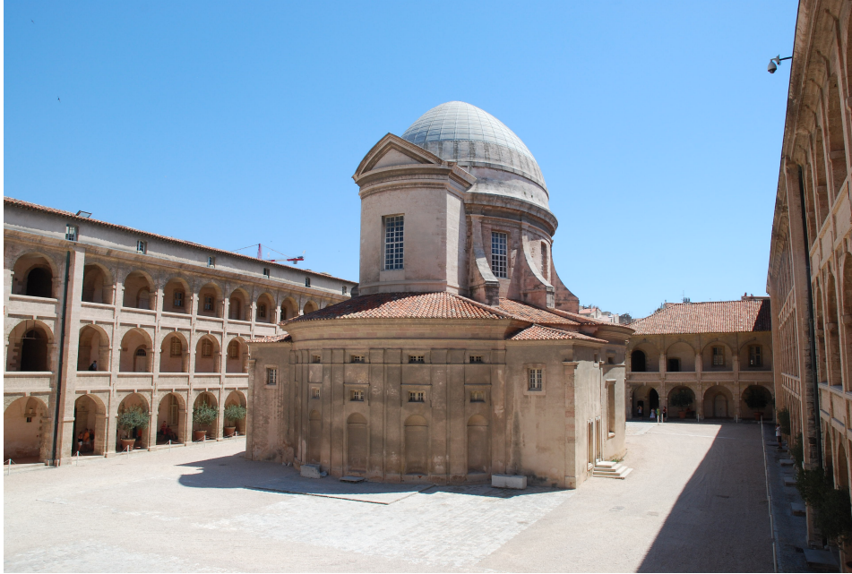
Illustration 3: Pierre Puget, Chapelle et hospice de la Charité, Marseille, 1671-1749