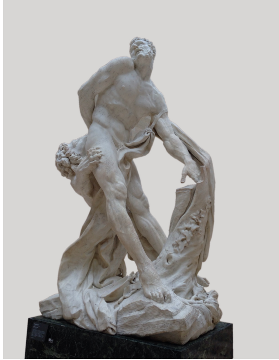
Illustration 1: Pierre Puget, Milon de Crotone [Marbre], Paris, musée du Louvre, 1676-1689